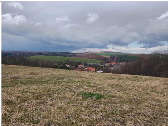
obr. 2 - V dálce potencionální ohrožená zástavba