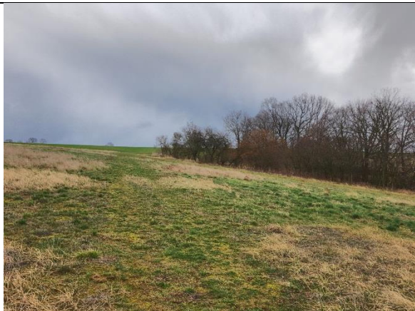
obr. 1 - Zdrojová plocha KB

Kritický bod, který byl nově identifikován dle vyjádření místních obyvatel. Nachází se pod zalesněnou strží vytvořenou postupným erozním zahlubováním. Zde se koncentruje odtok vzniklý ve vyšších částech povodí, kde se nachází orná půda středně zatížená erozním smyvem. Nejnížší části povodí jsou zatravněny.