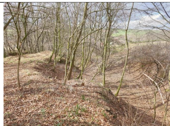
obr. 4 - Strž nad obcí Mrzky