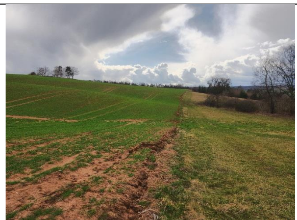
obr. 3 - Hranice orné půda a TTP, místo pro budoucí hrázku