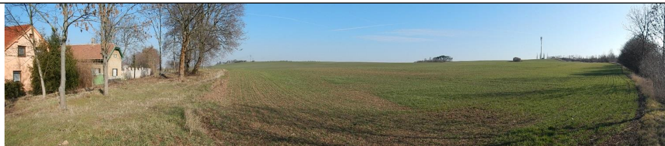
obr. 1 – Celkový pohled na KB a lokalitu nad ním

Stávající kritický bod se nachází mimo vodní tok na východním okraji částí obce Klučov - Lstiboř. Celé povodí kritického bodu je tvořeno zemědělskými pozemky, které jsou svažité směrem k zástavbě Lstiboře. Ohroženým místem je obytná zástavba na okraji obce, která není chráněná proti srážkovým vodám. Propustky pod místními komunikacemi nezajišťují jejich dostatečné odvedení.