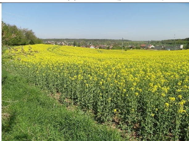
obr. 4 - Údolnice v povodí KB