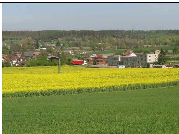
obr. 3 - Pohled ke KB