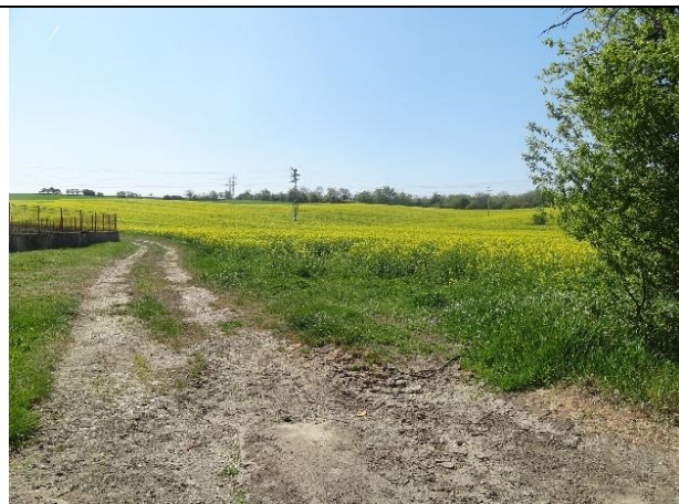
obr. 1 - Místo kritického bodu

Registrovaný kritický bod, který byl na základě terénního šetření přesunut o cca 100 m západním směrem, kde není dořešen převod odtoku přes silnici III/3307. Voda je odváděna příkopem podél silnice až do obecní kanalizace, ale za zvýšených průtoků kapacita nedostačuje a přelévá se přes silnice (absence propustku). Níže pod kritickým bodem je voda odváděna příkopem vedoucím podél intravilánu (není navázán na KB). Povodí je tvořeno téměř výhradně ornou půdou. Napříč povodím vede úvozová cesta, která však povrchový odtok nepřerušuje ani ho nespádá do jiného uzávěrového profilu.