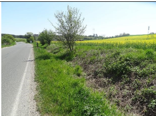
obr. 2 - Příkop podél silnice (pohled ke KB)