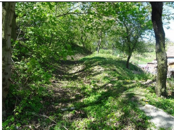
obr. 1 - Příkop vedoucí od kritického bodu směrem k další zástavbě

Kritický bod nově identifikovaný v rámci terénního šetření. Je umístěn v ohybu příkopu (údolnice), kde povrchový odtok koncentrován erodovanou údolnicí může v těchto místech přesahovat jeho kapacitu a ohrožovat zástavbu umístěnou pod ním. Zároveň může být ohrožena zástavba u konce příkopu. Povodí je tvořeno ornou půdou, z které je odtok odváděn hlavně údolnicí na SZ (pravděpodobně erodovaná bývalá cesta) až ke kritickému bodu.