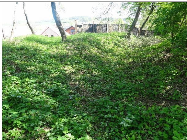
obr. 2 - Místo kritického bodu