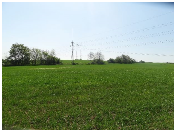
obr. 4 - Povodí KB