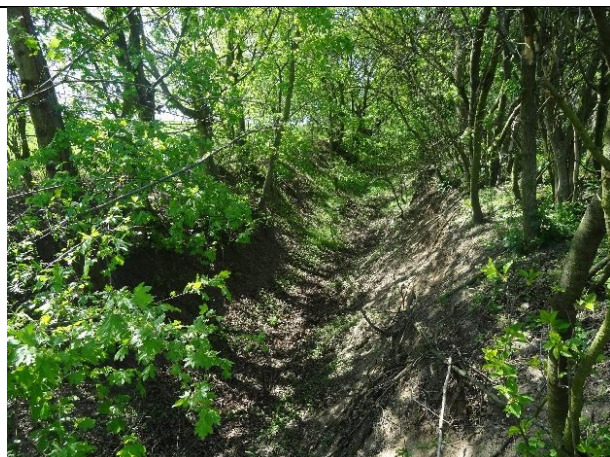
obr. 3 - Strž vedoucí ke KB