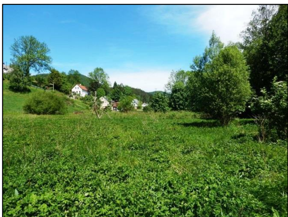
obr. 3 – bližší pohled do místa možného rybníka (dnes podmáčené území)