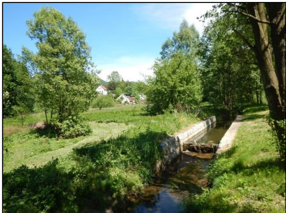
obr. 1 – pohled na uvažované místo bočního rybníka (vlevo)

Navrhuje se vytvoření bočního rybníka v centru Oldřichova v Hájích (poblíž obecního úřadu). Rybník by byl boční (s nátokem a výpustí) a s litorální částí pro podporu biodiverzity.