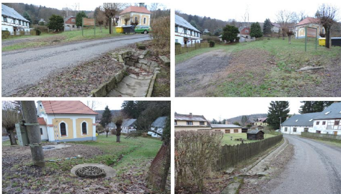
obr. 1 - Fotodokumentace ohroženého místa 0004

Lokalita byla v rámci analytické části definována jako ohrožená a evidovaná pod identifikátorem kritického bodu 0004 .