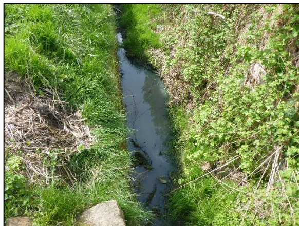
obr. 1 - Fotodokumentace znečištění povrchových vod