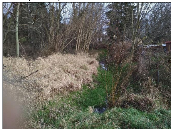
obr. 2 - Fotodokumentace zarostlého pravého inundačního území na území Polska (foceno směrem proti toku)

V rámci řešení lokality jsou navržena opatření pro snížení povodňového ohrožení.