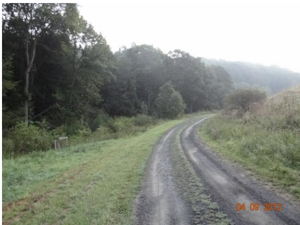
Koryto toku nad kritickým bodem.