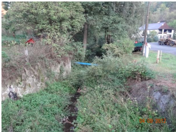
Lučinský potok pod soutokem.