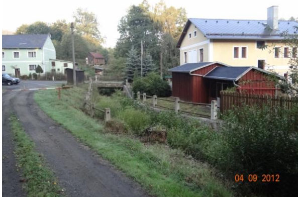
Most u Vojenských lesů a statků, s.p.