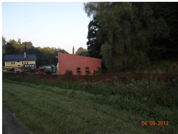
Ohrožený areál Vojenských lesů a statků, s.p.