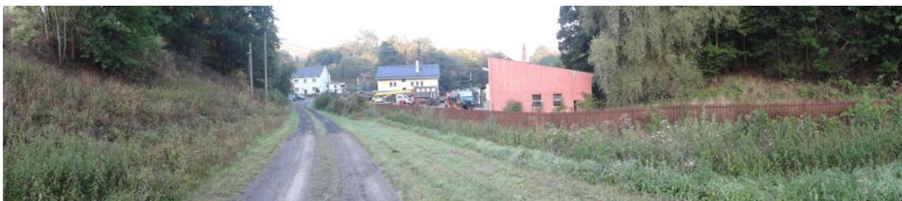
Celkový pohled na údolí areálu VLS, s.p.