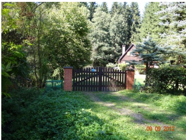
Ohrožený objekt chaty č. 39 a 40.