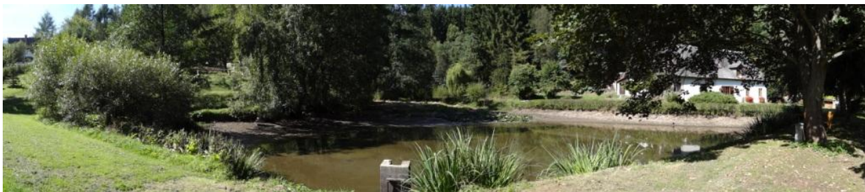
Celkový pohled na rybník.