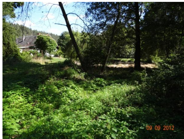
Tok nad rybníkem.