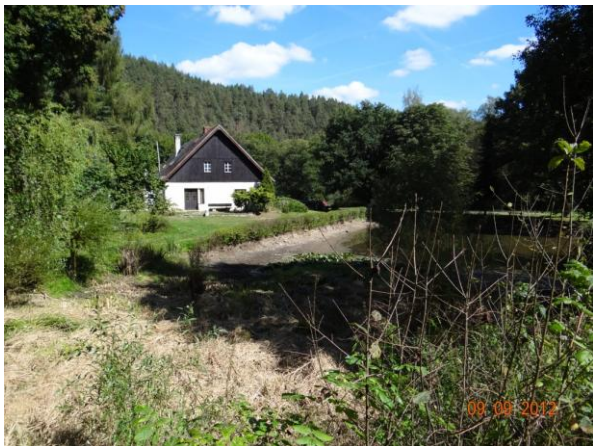
Rybník u č.p. 37. Výpustní zařízení nebude kapacitní.