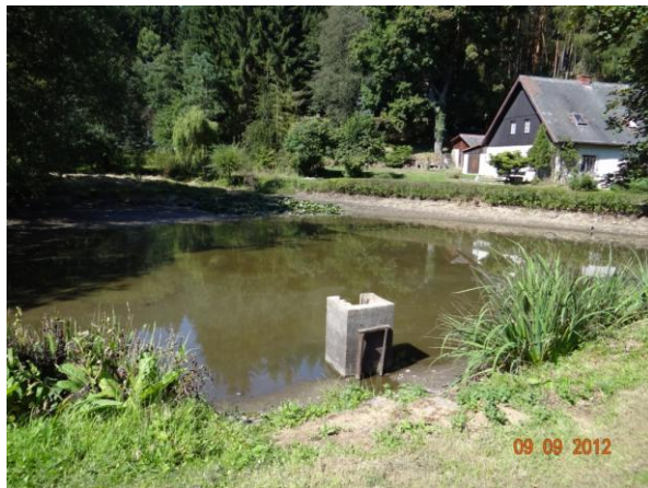
Objekty č.p. 37 a 38 budou ohroženy minimálně.