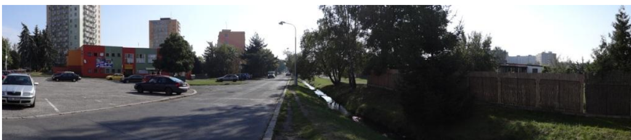
Zcela nekapacitní koryto v Chodově nad autobusovým nádražím.