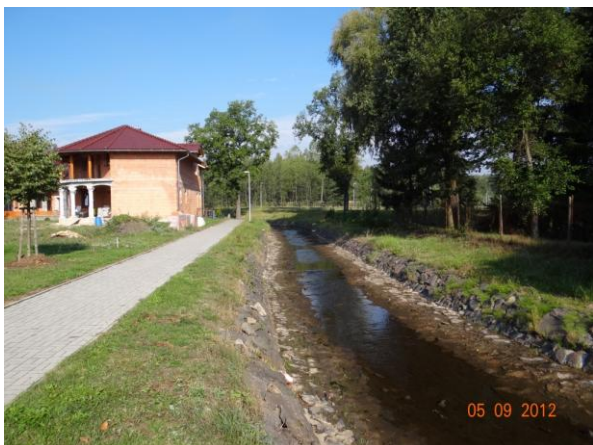
Nově budované rodinné domy jsou přímo ohroženy.