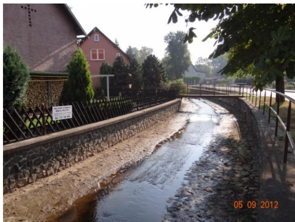
Regulované kapacitní koryto v centru Vintířova.