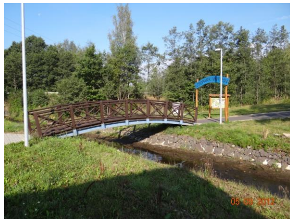
Nová lávka ke sportovní-rekreačnímu areálu.