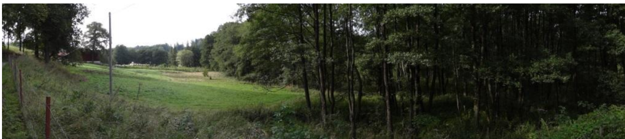
Ohrožené zemědělské plochy Farmy Verněřov.