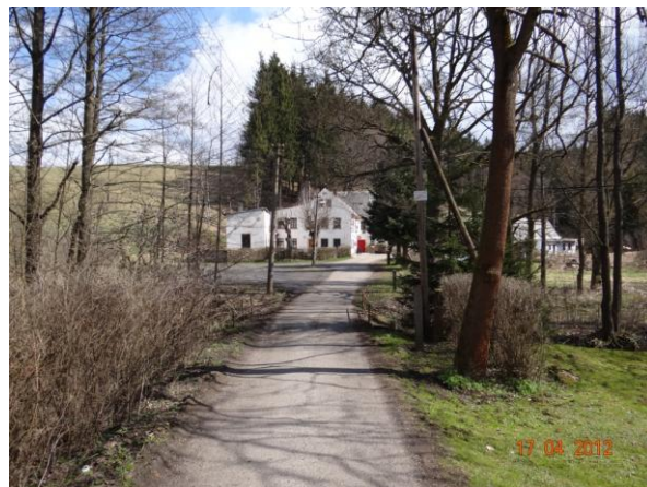
Ohrožené objekty okolo č.p. 25 pod Verněřovským rybníkem.