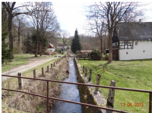
Koryto toku v Dolních Pasekách