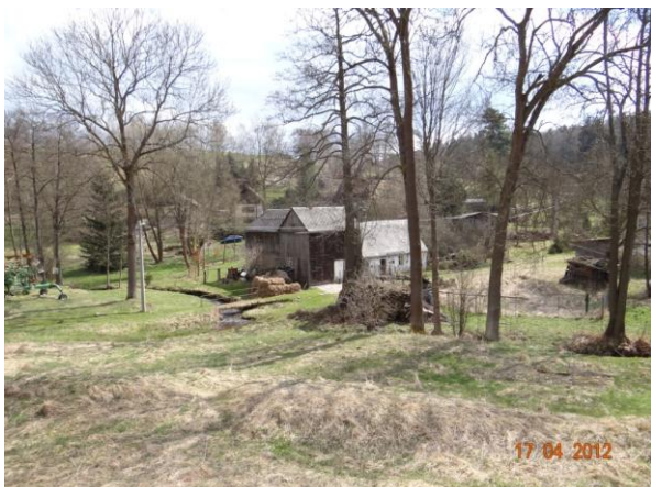
Ohrožené obytné a hospodářské budovy v Dolních Pasekách.