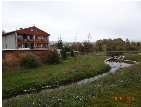
Revitalizovaná úsek toku, může dojít i k ohrožení rodinných domů.