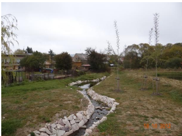
Revitalizované koryto nebude pro povodňové průtoky kapacitní.