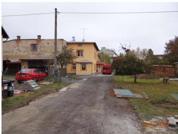
Ohrožené zahrady a objekty nad prádelnou.