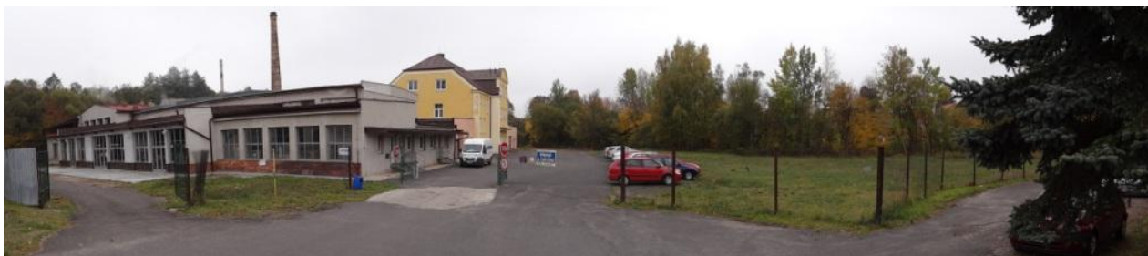
Ohrožený areál prádelny.