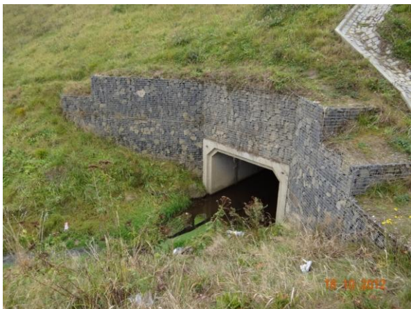
Krytý profil odtoku z rekreačního střediska Riviera pod novým obchvatem obce.