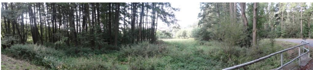
Celkový pohled na nivu toku pod mostem 194-002.