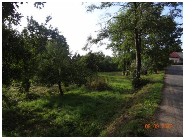
Pohled na tok k č.p. 153.