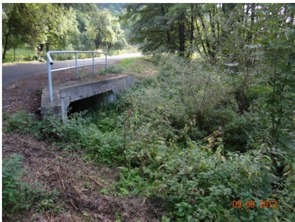
Most 194-002 nad kritickým bodem.