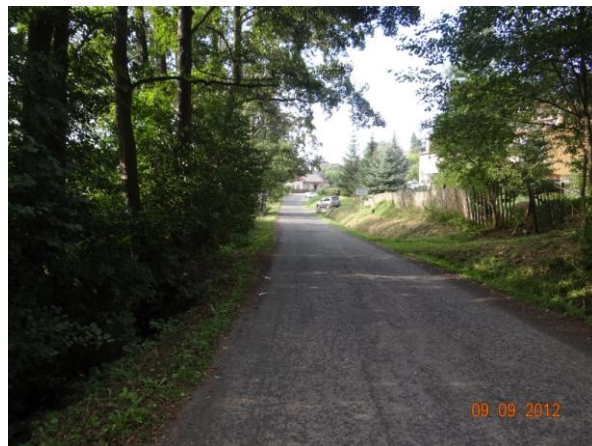
Komunikace II/194 bude zaplavena.