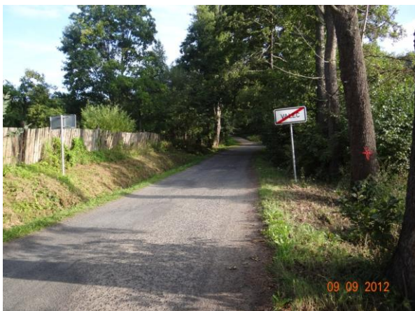
Koryto kopíruje od mostu 194-002 komunikaci, může dojít i k destrukci komunikace.