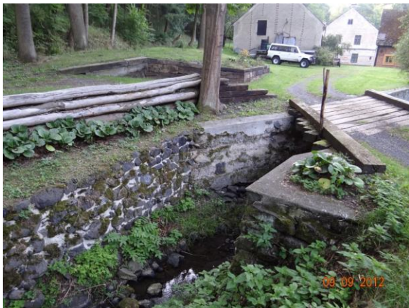
Mostek ke mlýnu, dojde k jeho přelití.