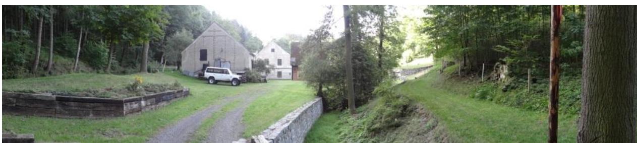
Celkový pohled na ohrožený areál Hamerského mlýna.