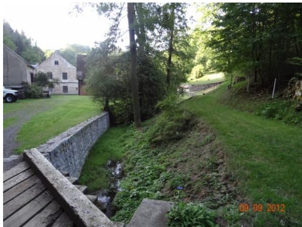
Koryto toku pod mostem.