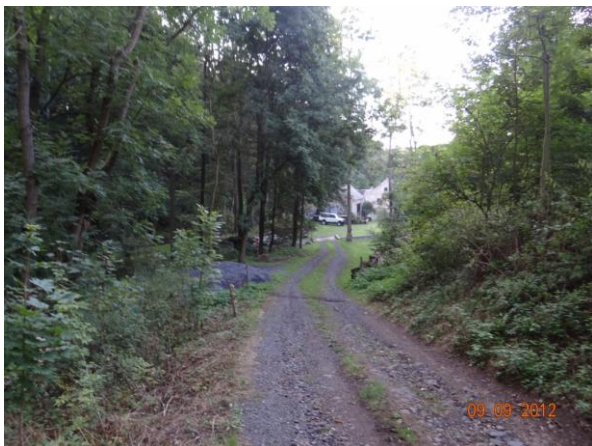
Příjezdová cesta k Hamerskému mlýnu.