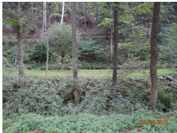
Pstruhový rybník nad mlýnem.