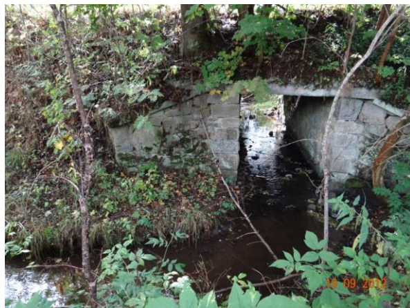
Most v místě kritického bodu - nátok na most je v konkávě namáhán.