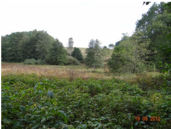
Niva toku ve sběrné ploše.