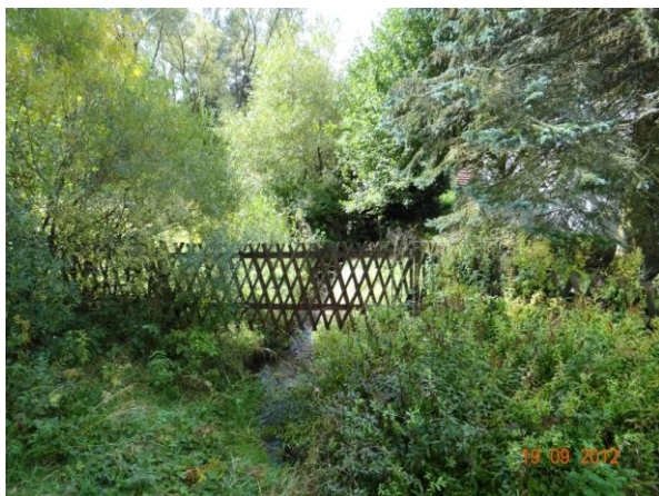
Plot zahrady č.p. 58 přes koryto toku.