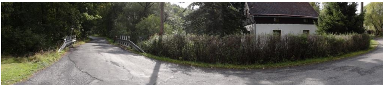
Pohled na č.p. 58 a okolí.