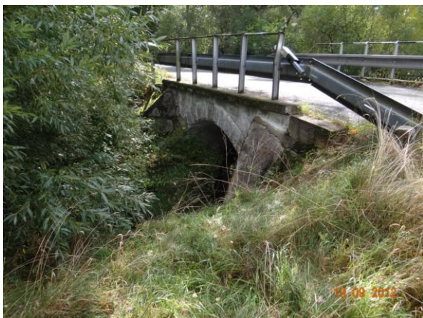
Spodní most u č.p. 58.