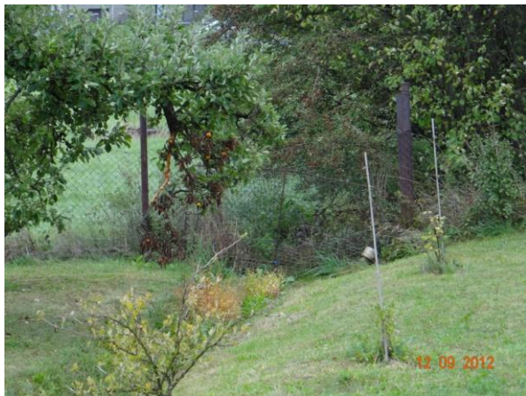
Ploty zahrad přes koryto.