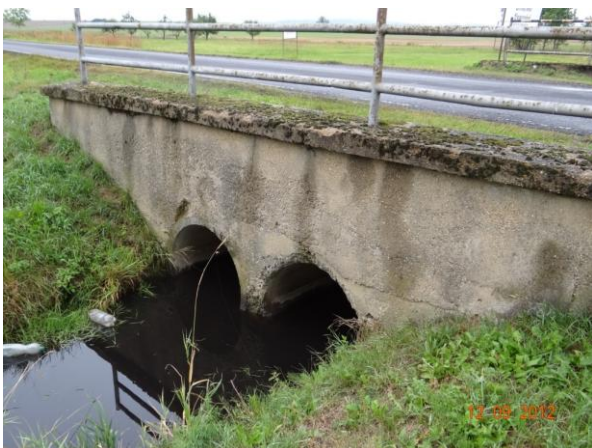
Trubní propust v silnici III/21217 nad rybníkem.