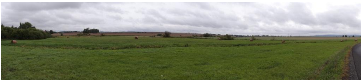
Niva toku pod obcí, místo neškodných rozlivů.