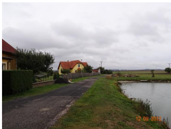
Hráz rybníka - nemovitosti pod hrází ohroženy.