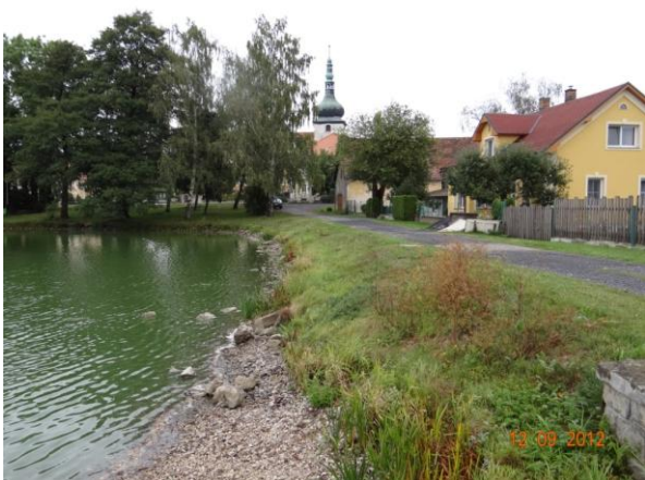
Hráz rybníka s nátokem na bezpečnostní přeliv.