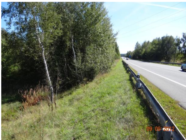
Těleso náspu komunikace I/20.