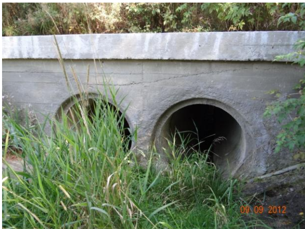
Trubní propust v tělese komunikace.