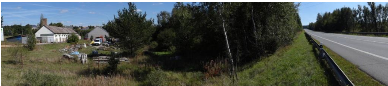
Celkový pohled na lokalitu kritického bodu.