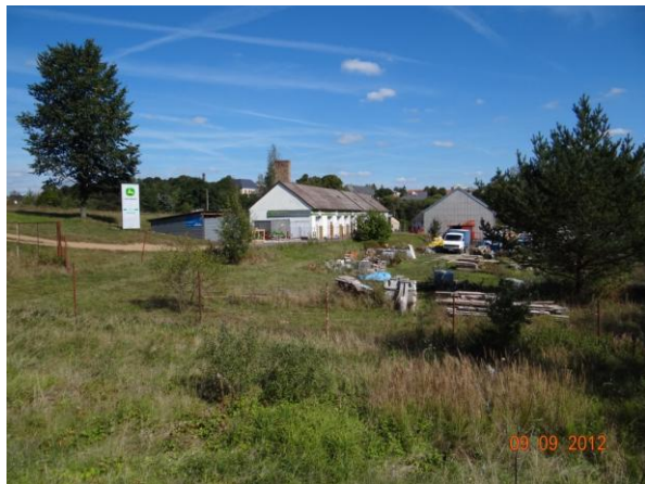
Nemovitosti pod komunikací jsou mimo potenciální rozlív.