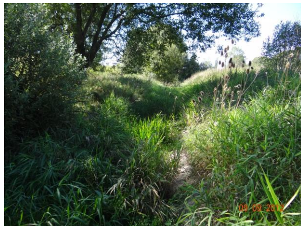
Tok nad silnicí I/20.