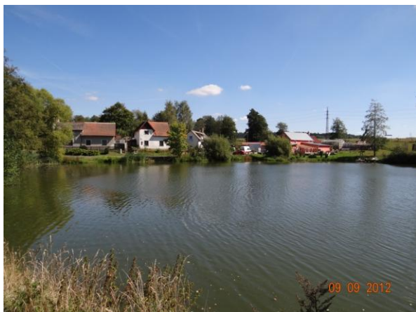
Pohled na ústí toku do rybníka Šinka.