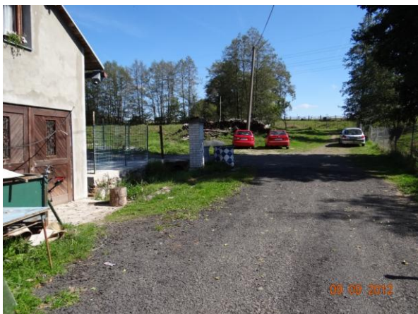
Ohrožená cesta a nemovitosti v místě krytého profilu toku.