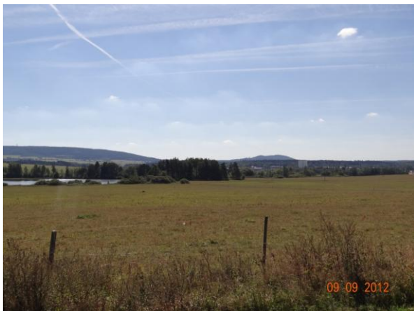
Sběrná plocha nad Toužimskými rybníky.