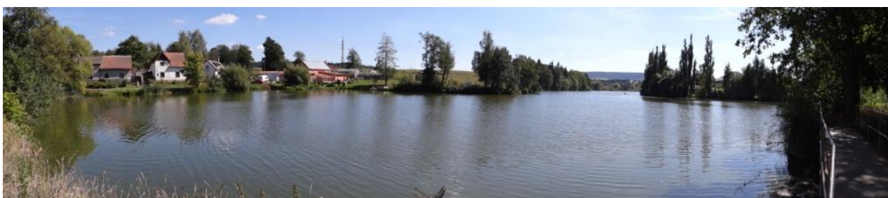
Celkový pohled na rybník Šinka.