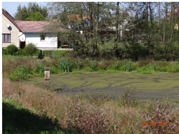
Vypuštěný rybník nad č.p. 350.