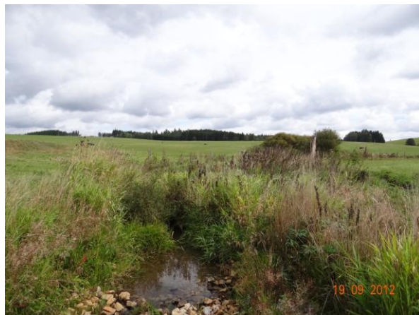
Beranovský potok nad mostem 210-010.