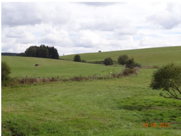
Sběrná plocha nad kritickým bodem.