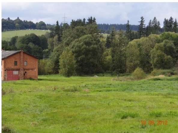
Plochá niva toku u statku č.p. 285. Objekt není využíván.