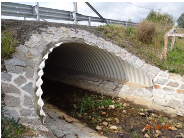
Nově rekonstruovaný most 210-010.