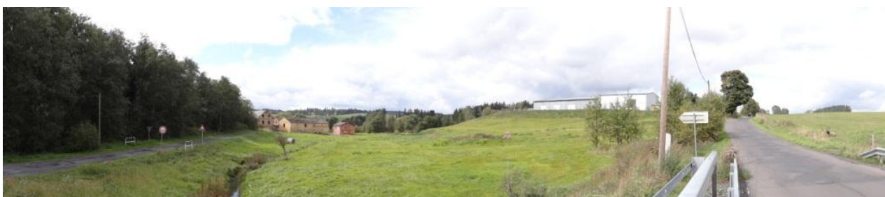
Celkový pohled na úsek od mostu 210-010 k ústí toku.