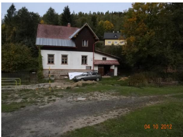
Objekt č.p. 528, ohrožení umocní nekapacitní mosty.