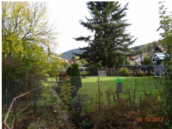
Přes koryto jsou vedeny ploty.