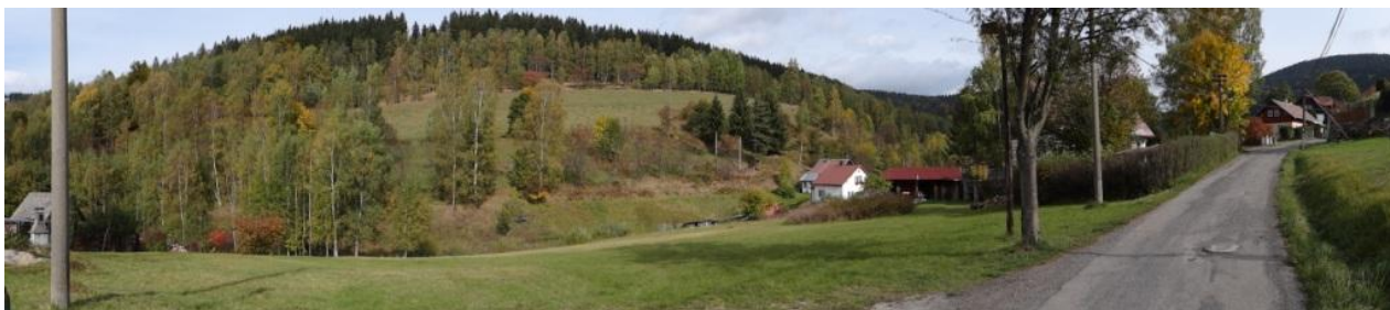
Pohled nad kritický bod do sběrné plochy.