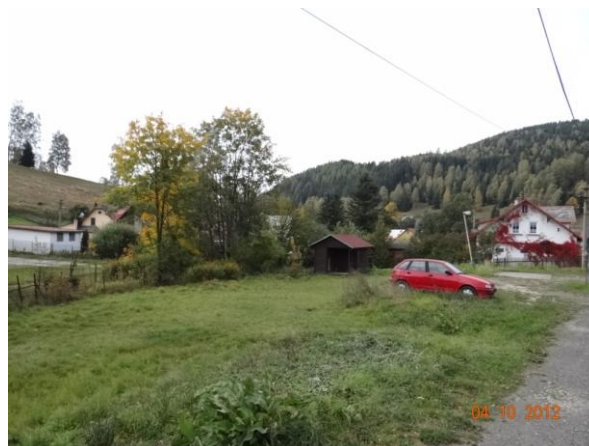
Niva toku pod č.p. 532, dojde k masivnímu rozlivu nad zahradami.