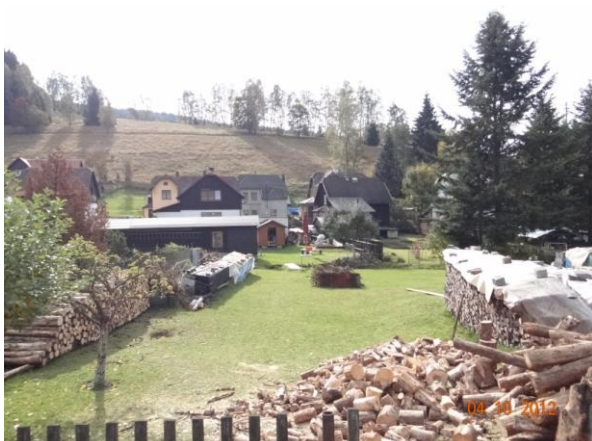
Zahrady rodinných domů - může dojít ke splavení velkého množství materiálu.