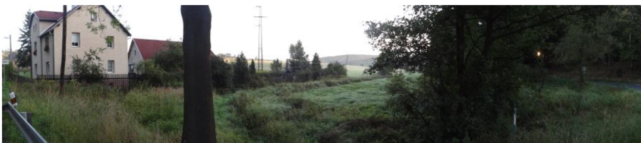
Celkový pohled na lokalitu u č.p. 92.