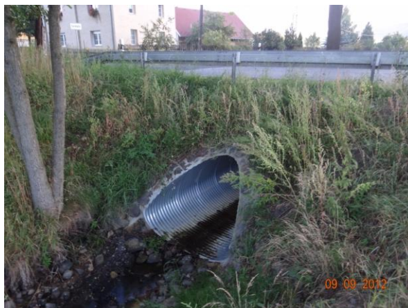
Rekonstruovaný most u č.p. 92.