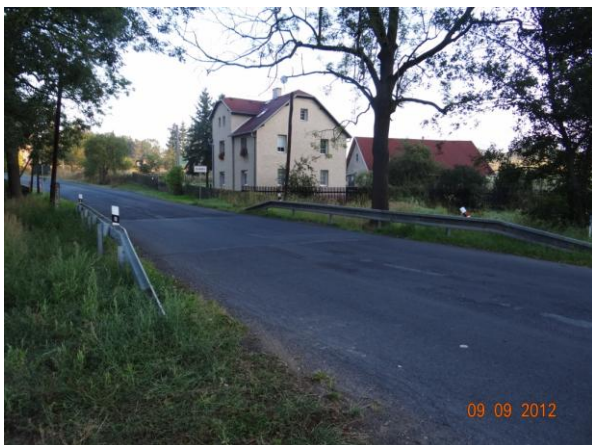
Ohrožený obytný objekt č.p. 92 v Žalmanově.