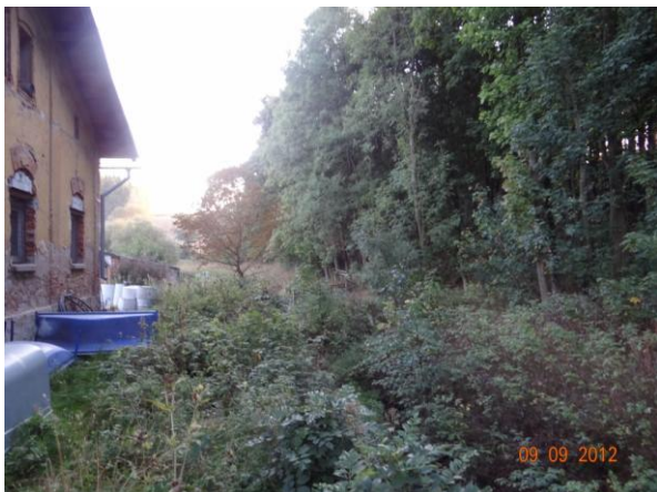
Koryto toku pod KB podél objektu č.p.73.