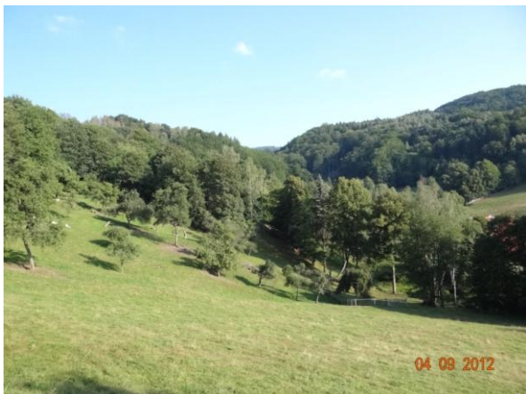
Sběrná plocha nad kritickým bodem.