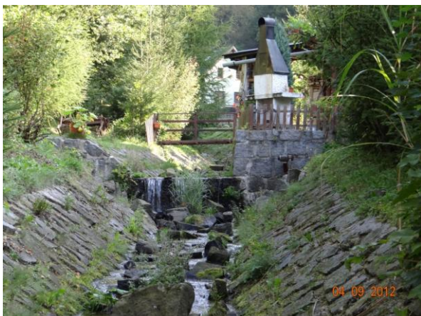
Regulované koryto podél objektu č.p. 166.