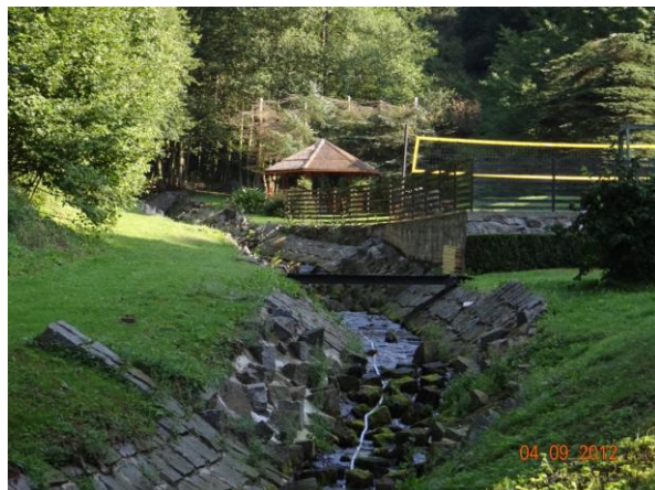
Regulované koryto podél objektu č.p. 167.