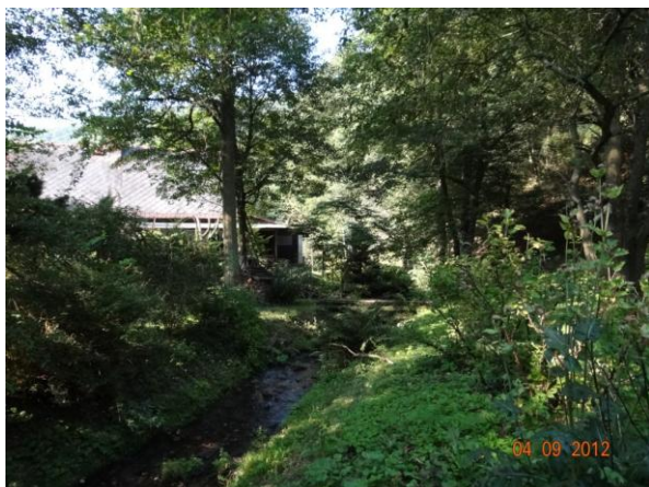
Tok podél objektů č.p. 163 a 162.