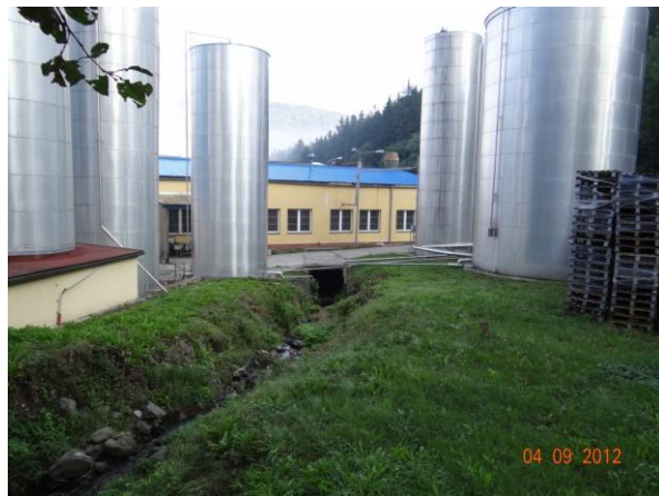
Areál Korunní s krytým profilem toku pod halami.