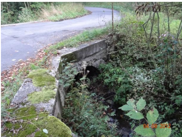
Most nad č.p. 48 - cesta do VÚ.