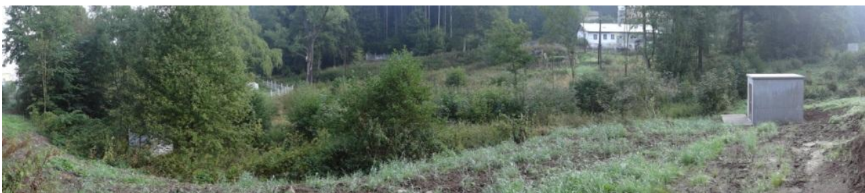
Údolí toku nad areálem Korunní - u jímacích objektů.