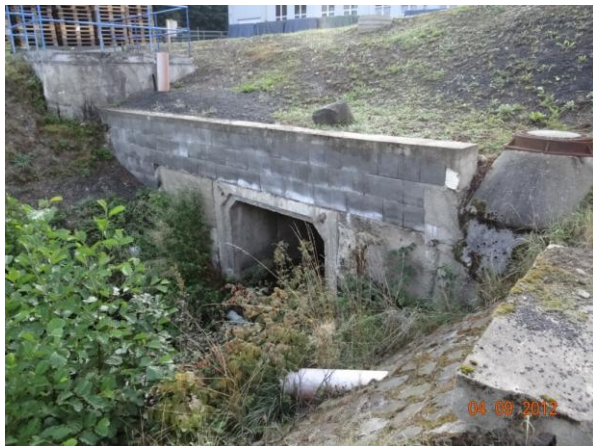
Vyústění krytého profilu za vrátnici do areálu.