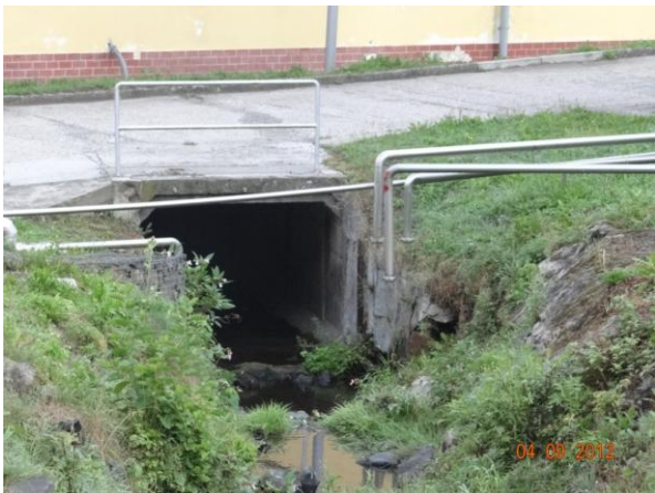
Detail nátoku do krytého profilu.