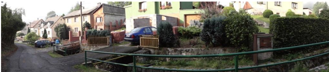
Většina obytné zástavby podél Pekelského potoka.