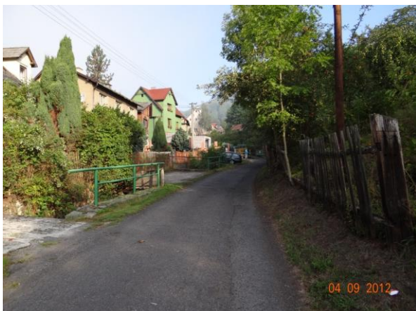
Situaci zkomplikují nekapacitní mosty a lávky.