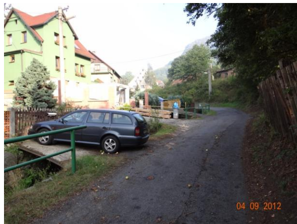
Ohrožená zástavba podél Pekelského potoka.