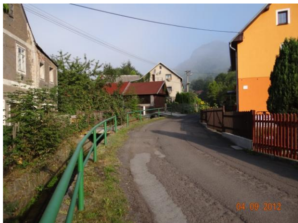
K záchytu splávi může dojít i na zábradlí.