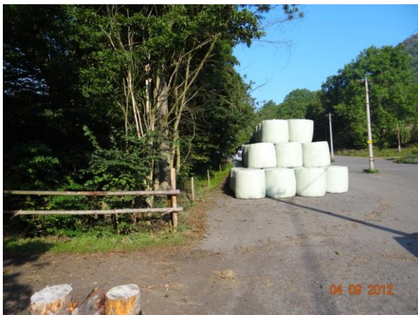
Koryto Pekelského potoka v areálu Statku Stráž n/O.