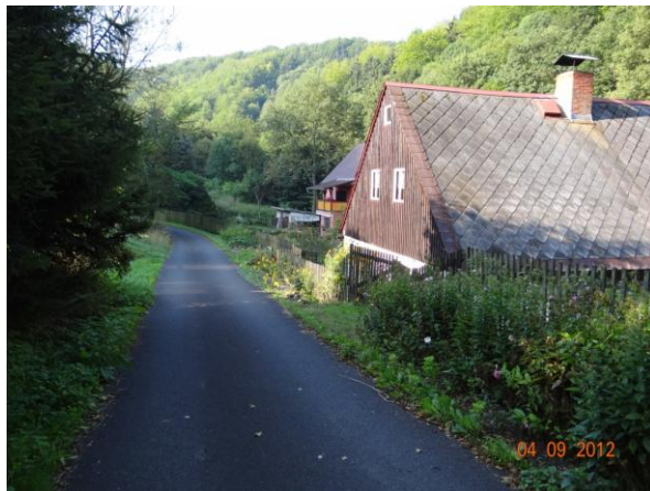
Ohrožené objekty č.p. 163 a 162.