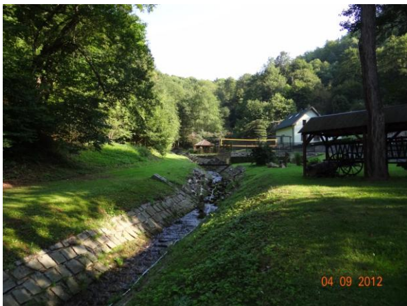
Regulované koryto podél objektu č.p. 167.