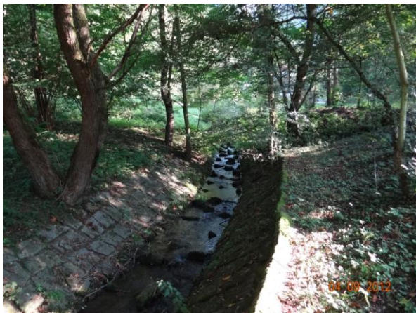
Tok podél objektů č.p. 163 a 162.