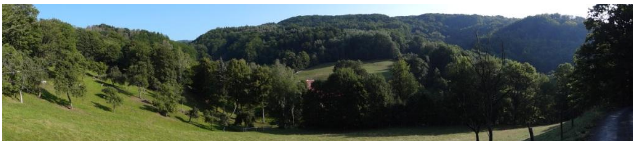
Pohled na část přispívající plochy.