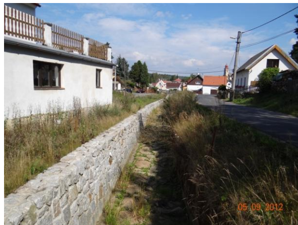
Revitalizované koryto u č.p. 106.