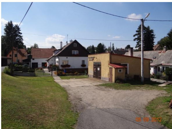
Ohrožená obytná zástavba v centru.