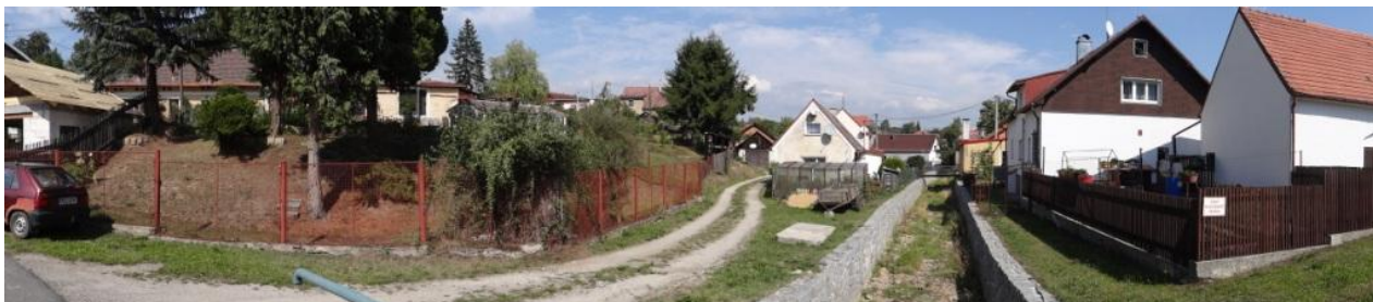
Ohrožené centrum Starého Sedla.