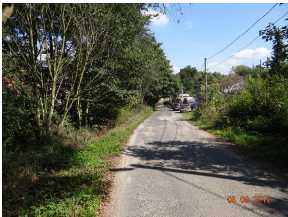
Koryto Starosedelského potoka v horní části obce.