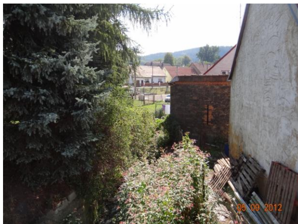
Koryto nad mostem 2099-4 u č.p. 71.