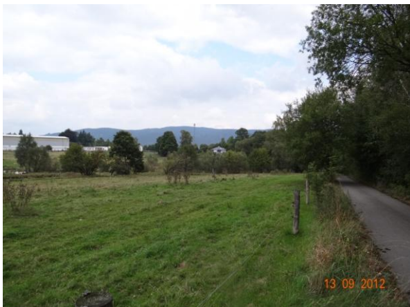
Část sběrné plochy nad kritickým bodem.