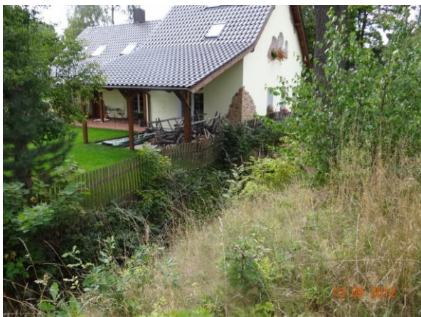
Ohrožený objekt č.p. 73.