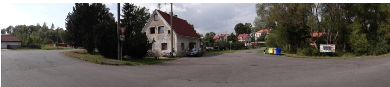
Celkový pohled na ohroženou lokalitu u č.p. 115.