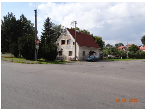
Ohrožená dolní část obce, křižovatka u č.p. 115.