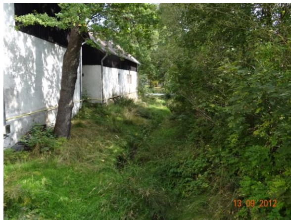
Koryto za Autoservisem Musil