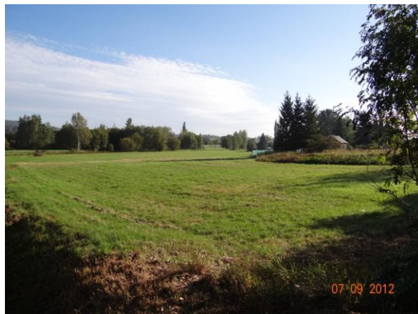
Plochá niva toku s možností rozlivů.