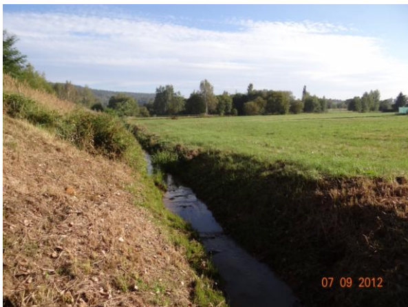
Koryto toku nad kritickým bodem.