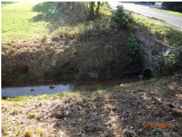
Trubní propust v tělese komunikace.