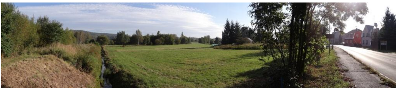
Celkový pohled na nivu a louky nad kritickým bodem.