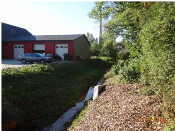
Mírně ohrožený objekt Ventop.