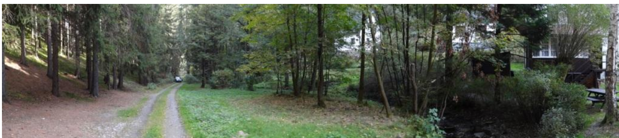
Pohled po toku na ohrožené rekreační objekty a cestu.