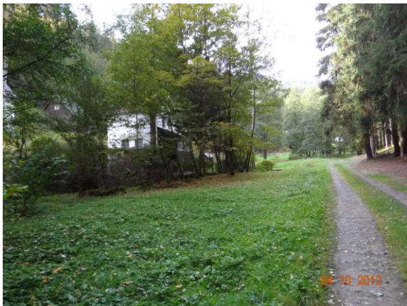
Ohrožený objekt č.p. 80.