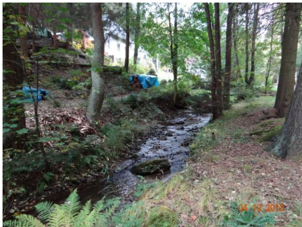
Koryto nad trať.