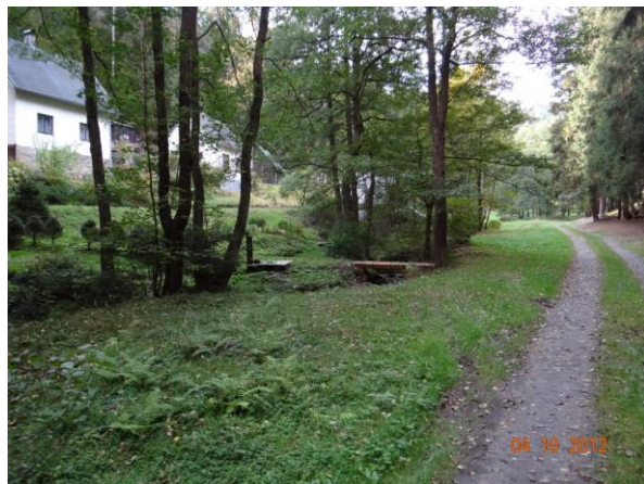
Situaci zkomplikují dřevěné lávky.