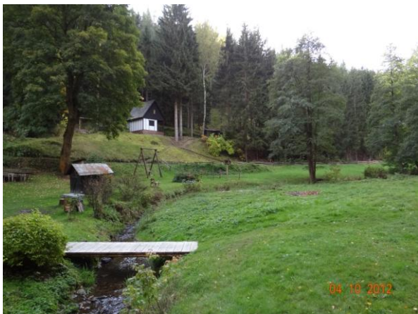
Koryto podél rekreačních objektů.