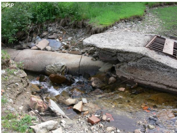
Destruovaná hráz rybníka v Mlýnské - foto 2011.