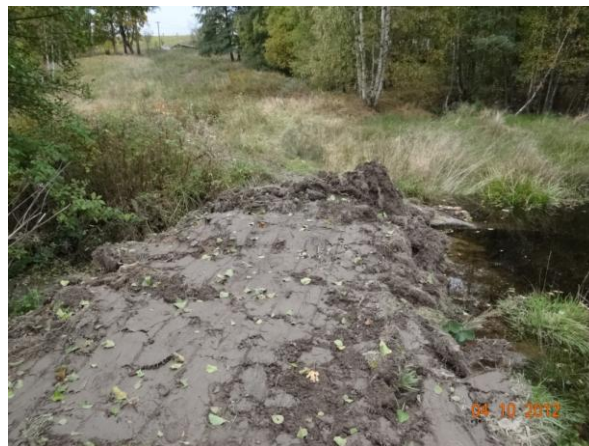
Hráz nevhodně zavožena - foto 09/2012.