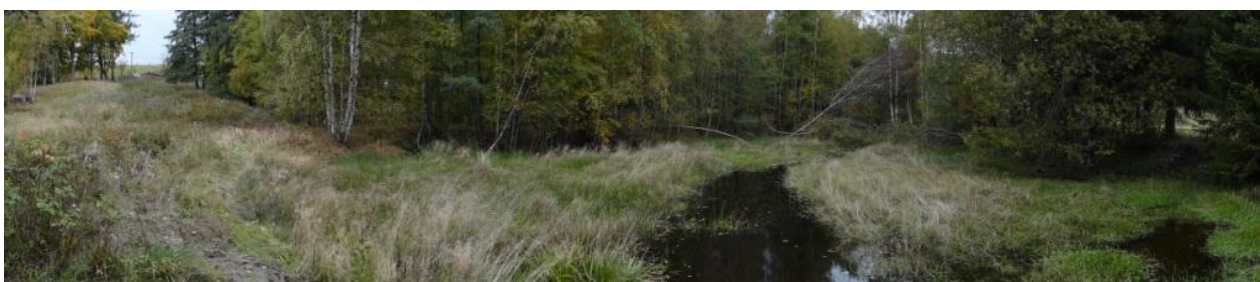
Celkový pohled na nivu a zátopu protrženého rybníka.