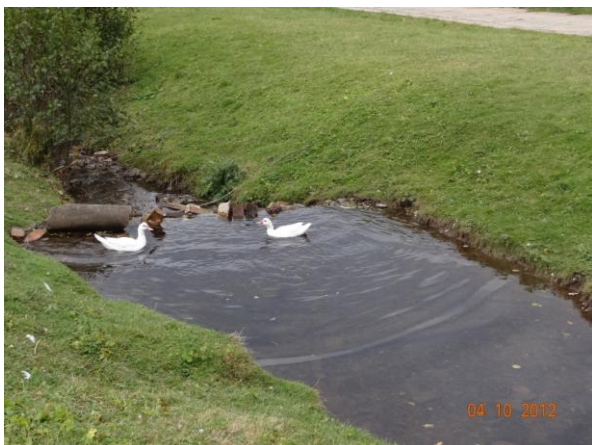
Umělé přehrážky pro kachny.