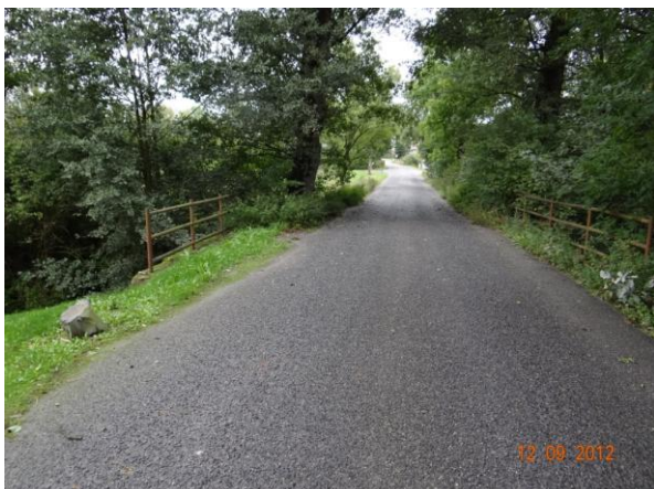
Most u Kazdova dvoru.