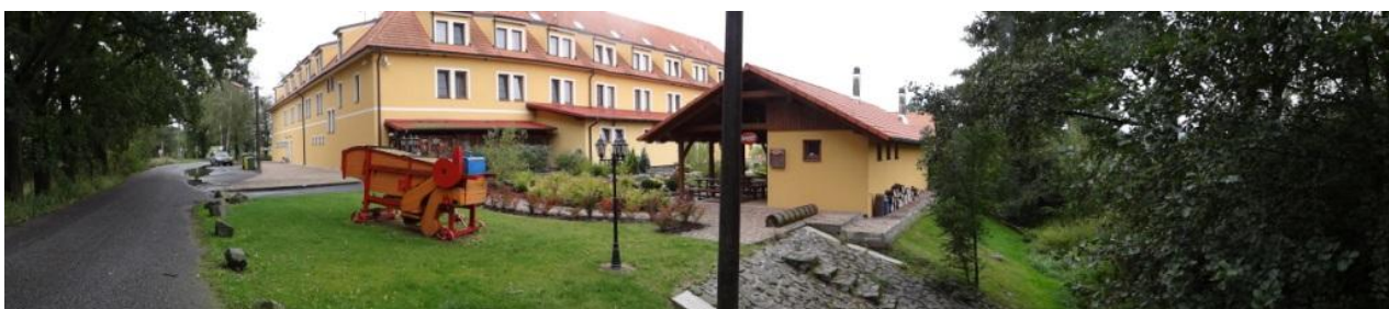
Celkový pohled na ohrožený areál Kazdova dvoru.