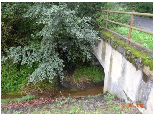
Detail profilu mostu.