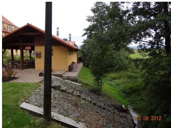
Objekt zázemí Kazdova dvora pod kritickým bodem.