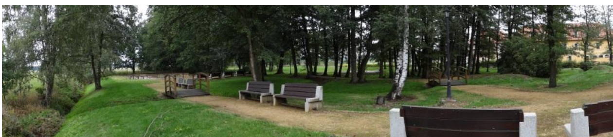
Celkový pohled na ohrožený park.