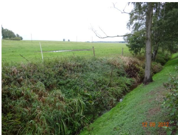
Koryto podél parku.