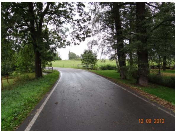
Most u parku ku Kazdova dvoru.