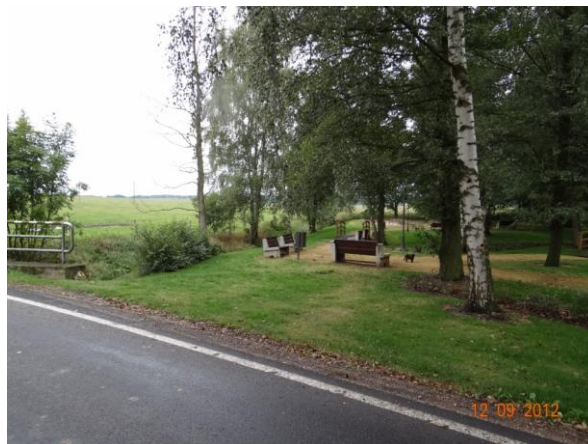
Park nad mostem.