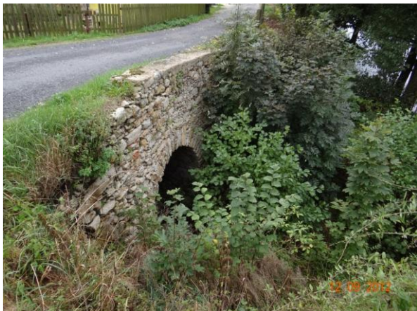
Klenbový most v komunikaci - přeřad bezpečnostního přelivu Nového rybníka.