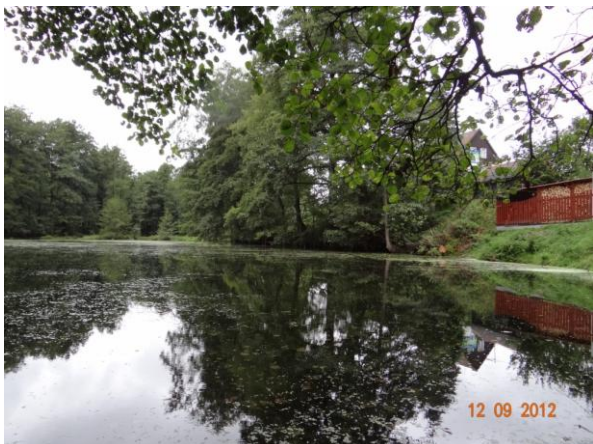
Rybník pod kritickým bodem.