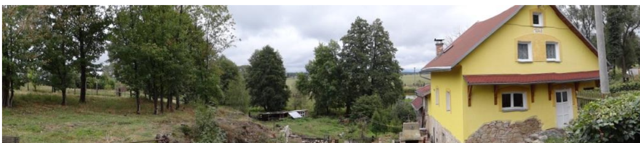
Celkový pohled na ohroženou lokalitu u č.p. 73.