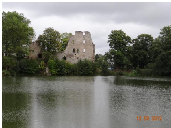
Hlavní rybník ve Starém rybníku.