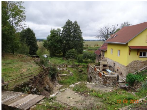
Ohrožený objekt č.p. 73.