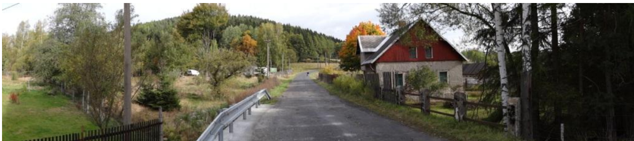
Celkový pohled na ohrožené nemovitosti u kritického bodu.