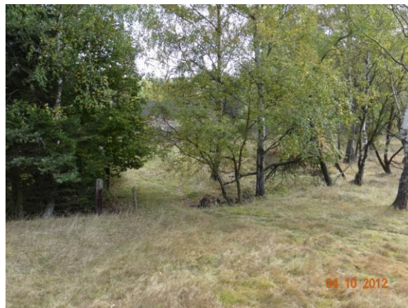
Koryto potoka pod mostem.