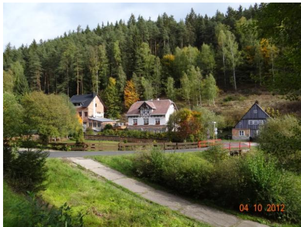
Dolní most v Dolní Rotavě.