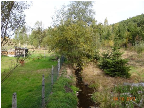
Koryto Novoveského potoka podél zahrady objektu č.p. 270.