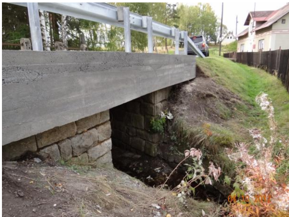
Most u č.p. 36.