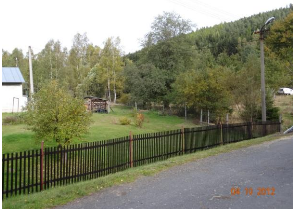
Zahrada ohrožené nemovitosti č.p. 270.