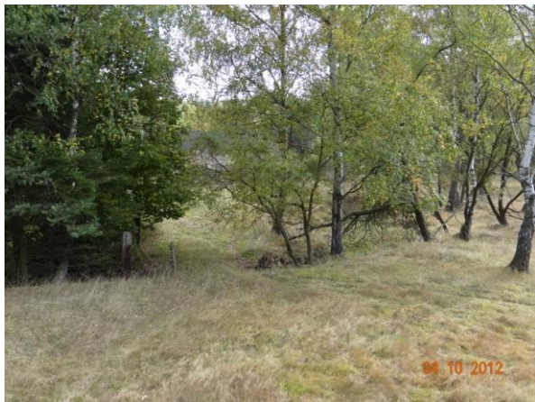
Koryto potoka pod mostem.