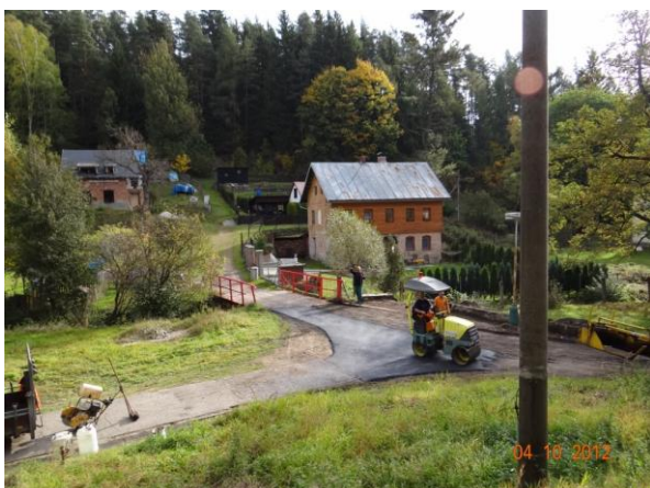
Dolní most k č.p. 43.