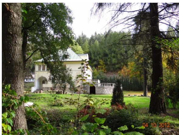
Objekt č.p. 202 na LB nad ústím Novoveského potoka do Rotavy.