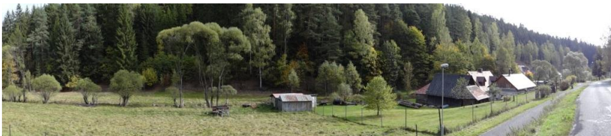
Celkový pohled na nivu toku nad zástavbou v Dolní Rotavě.