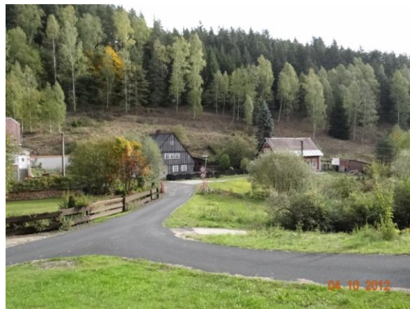
Horní mostek k č.p. 46. Nemovitosti při přelítí mostu ohroženy.