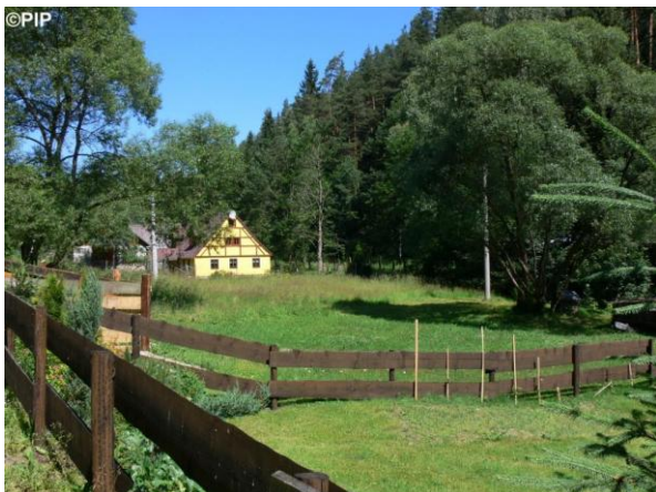
Niva toku v Dolní Rotavě s ohroženými rodinnými domy.