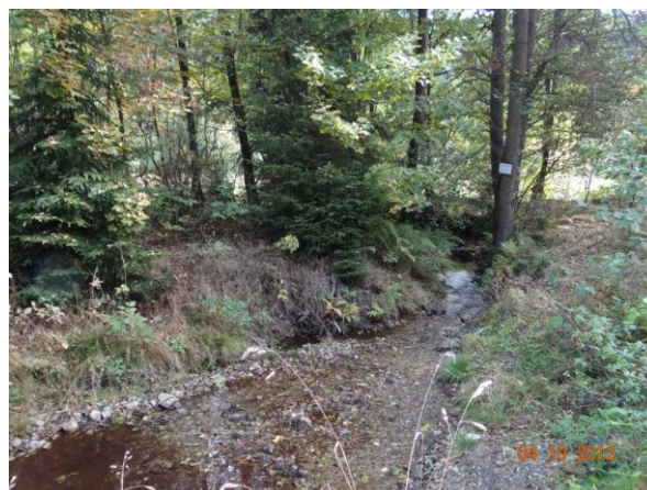
Tok pod cestou.