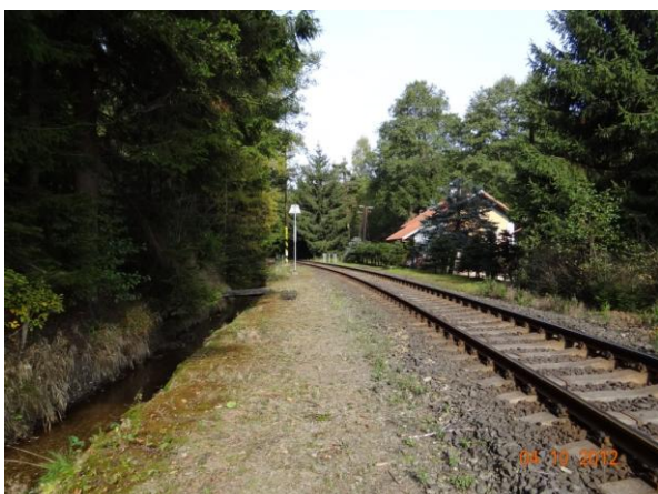
Souběh přeložky toku se železniční tratí.