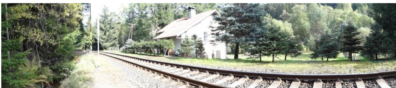
Celkový pohled na ohroženou trať a drážní domek č.p. 41.