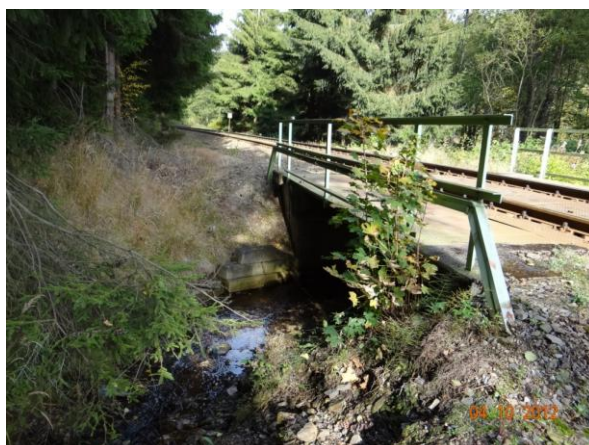
Propust v železničním náspu.