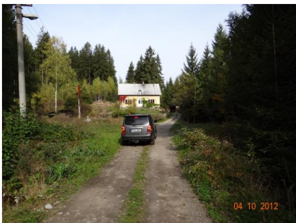
Cesta od vlakového nádraží k chatám - místo kritického bodu.