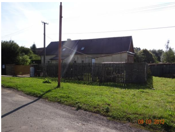
Ohrožený objekt č.p. 60 pod kritickým bodem, krytý profil toku.