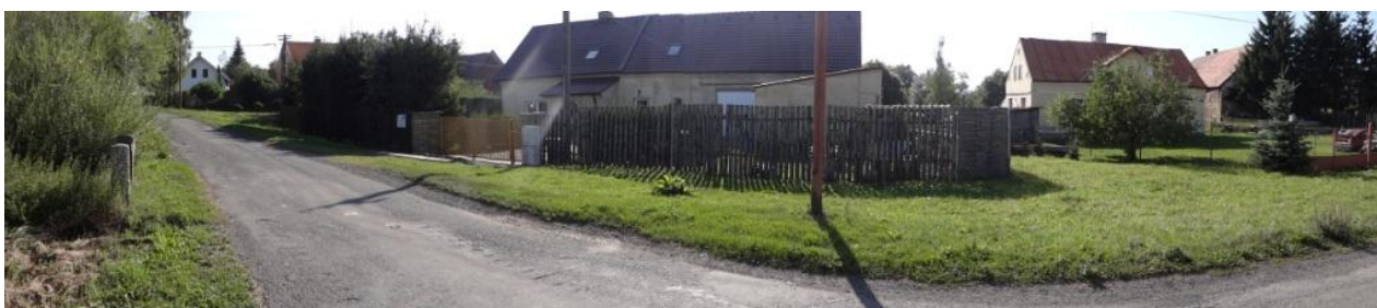
Celkový pohled na ohrožené objekty č.p. 59 a 60.