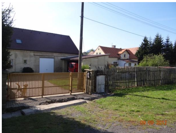
Ohrožený objekt č.p. 59 pod kritickým bodem.