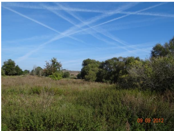
Sběrná plocha se zarostlým korytem.