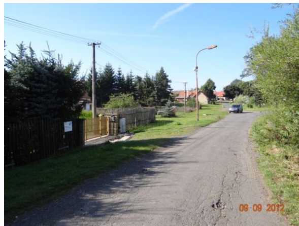
Místní komunikace k Protivci.