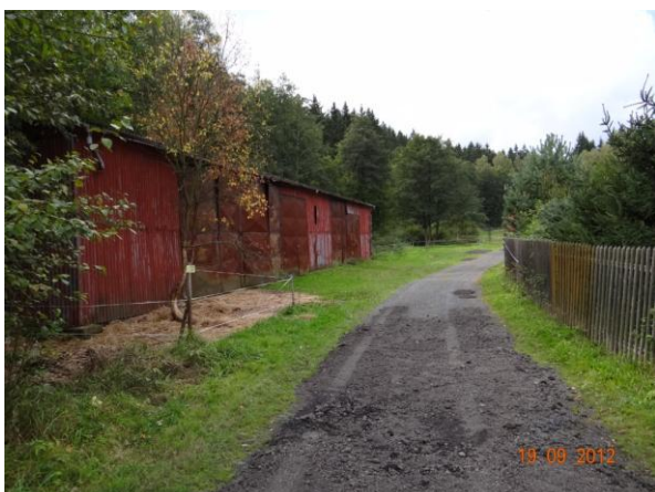
Ohrožená montovaná plechová zemědělská hala.