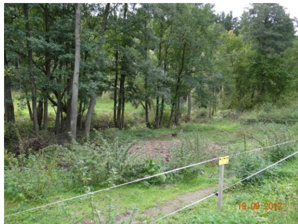
Tok nad zemědělskou halou.