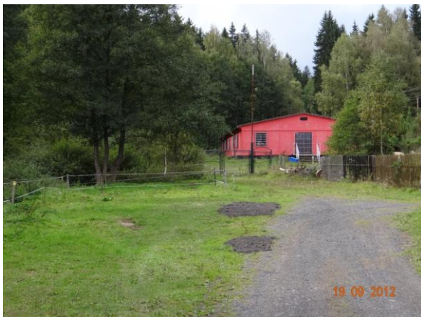
Montovaný objekt na okraji potenciálního rozlivu toku.