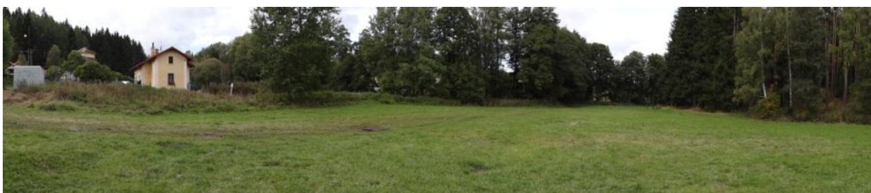
Celkový pohled na nivu nad tratí - dojde k ohrožení i drážního domku č.p. 30.