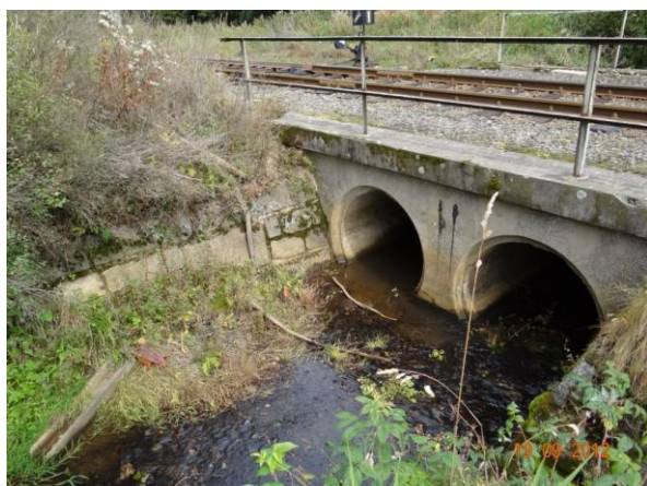
Limitující propustí v železniční trati.