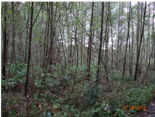
Niva toku nad kritickým bodem.