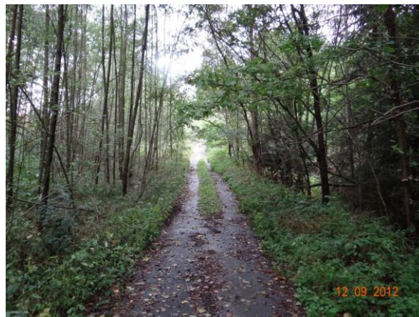
Účelová cesta - místo kritického bodu.