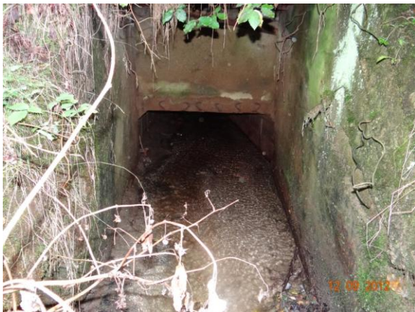
Propust v cestě.