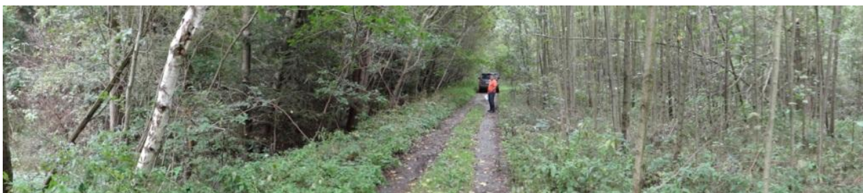
Celkový pohled na lokalitu.