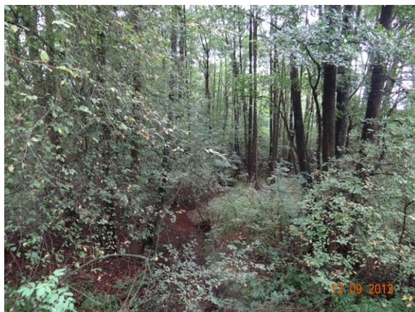
Níva toku pod kritickým bodem.