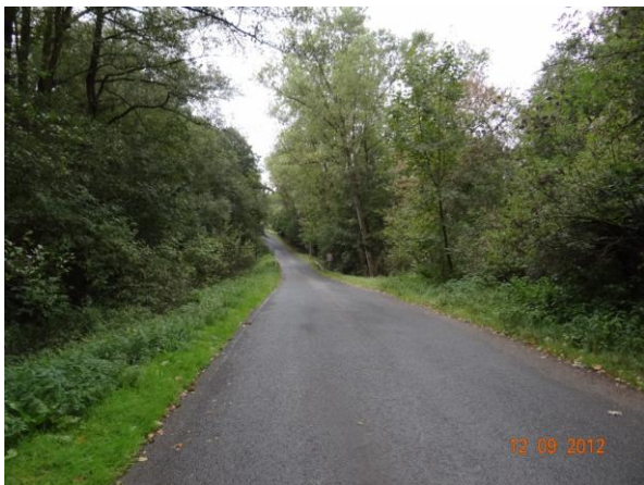
Komunikace III/21241 - místo kritického bodu..