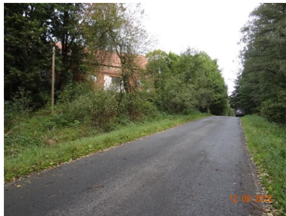
Objekt č.p. 4 leží vysoko nad korytem mimo potenciální rozliv.