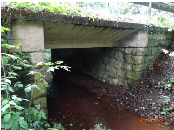
Profil mostu 21241-1.