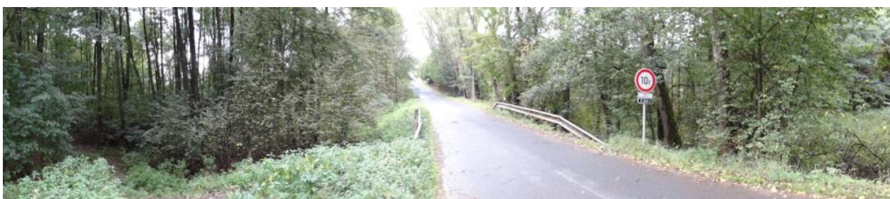
Celkový pohled na lokalitu.