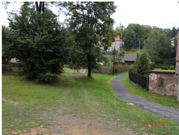
Úsek krytého profilu.