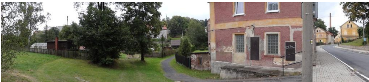
Celkový pohled na ohrožený objekt č.p. 213 u krytého profilu toku.