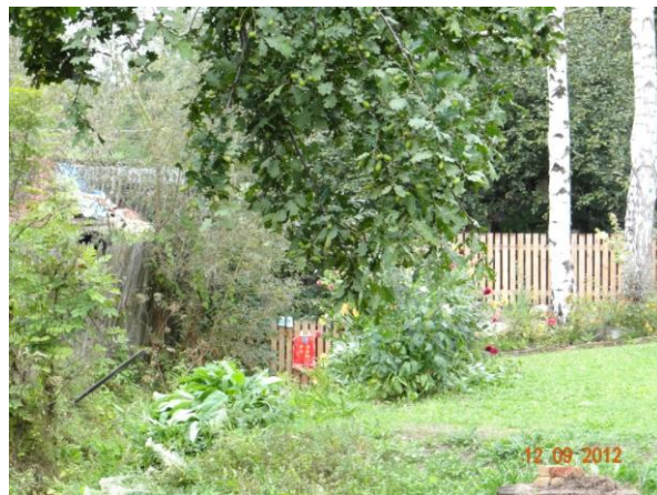
Plot přes koryto.