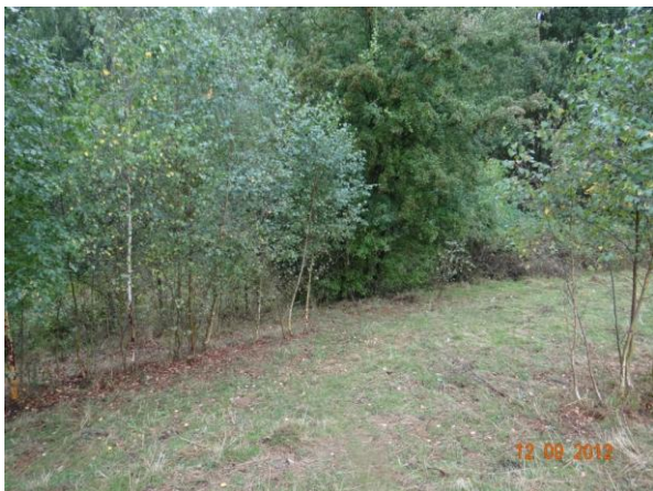
Koryto toku nad č.p. 49 (místo kritického bodu).