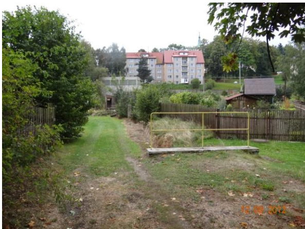
Vyústění krytého profilu podél č.p. 213.