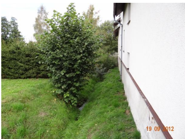
Koryto podél objektu č.p. 77.