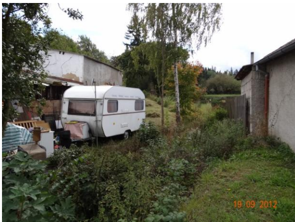
Koryto toku mezi č.p. 9 a 112. Komplikace může způsobit stržení karavanu.