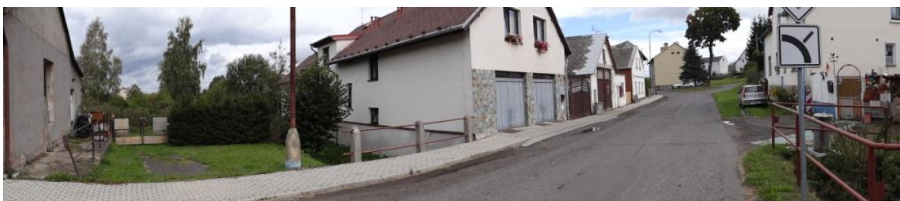
Celkový pohled na ohroženou lokalitu u č.p. 77.