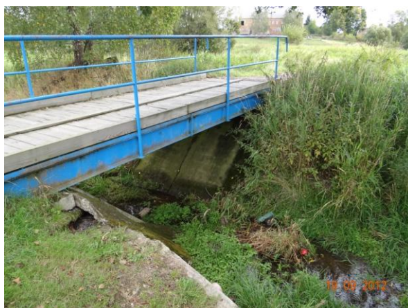
Lávka k rybníku.