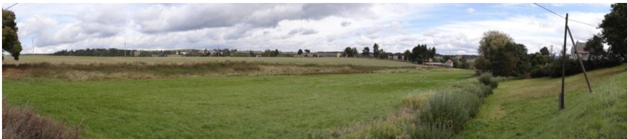
Pohled na ústí toku do Nadluckého potoka.