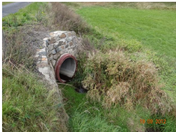
Trubní propust v silniční komunikaci - dojde k záchytu stržených plotů.