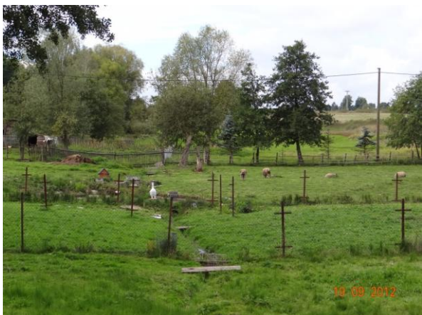
Pletivé ploty nad spodním mostem v obci.