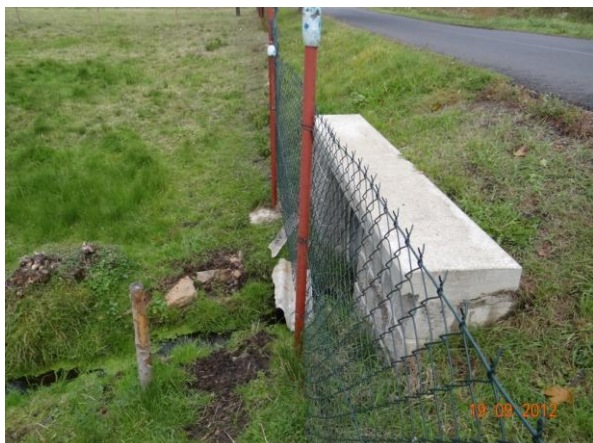
Plot přímo u nátoku na propust.