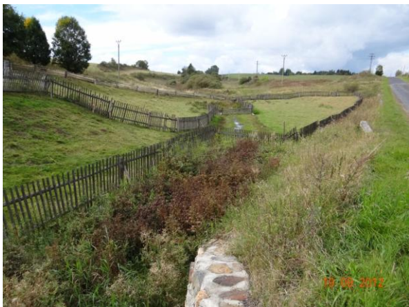
Ploty přes koryto přímo pod kritickým bodem.