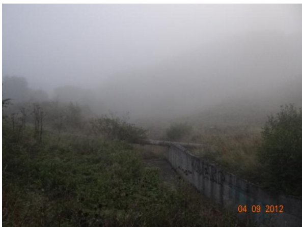
Odtok od mostu směrem k Bystřici.