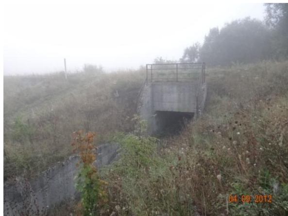
Most v tělese příjezdové hráze k odkališti.