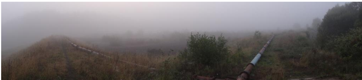
Celkový pohled na lokalitu odkaliště.