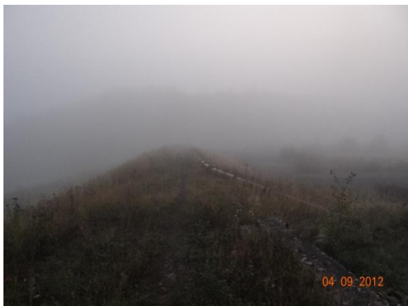
Těleso hráze odkaliště.