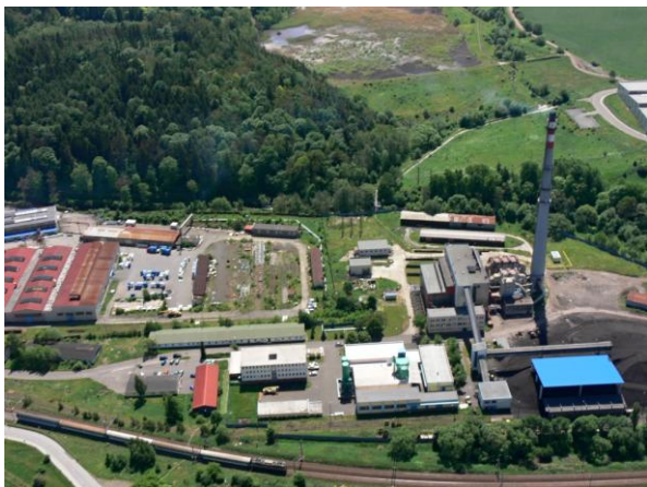
Areál Teplárny Ostrov, v pozadí odkaliště - místo kritického bodu.