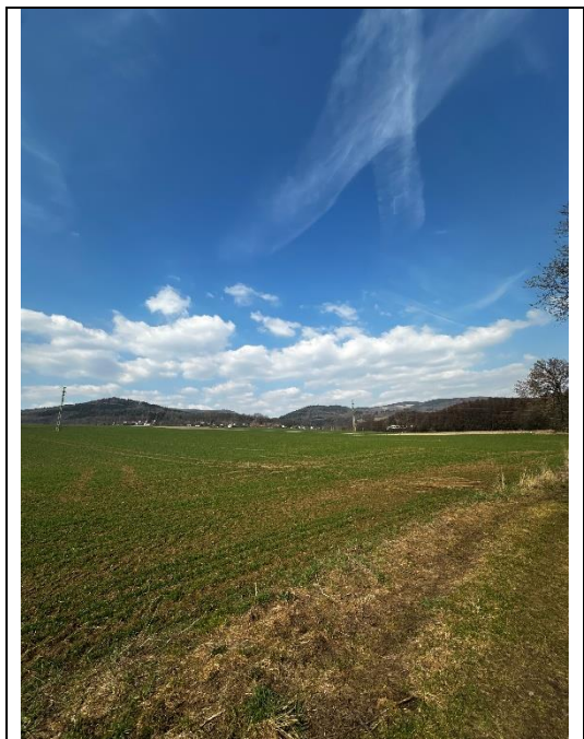
Pohled směrem do povodí KB