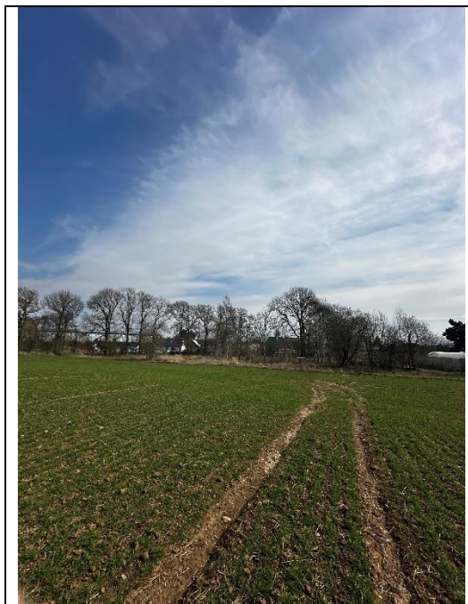
Pohled na KB směrem na obec Dolní Žďár