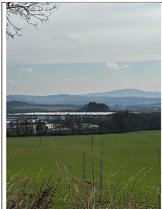
Pohled ze silnice III/22128 na ornou půdu směrem ke KB