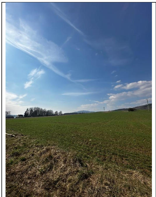
Pohled směrem do povodí KB, svažité půdní blok