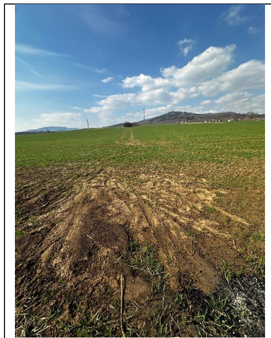
Známky vodní eroze v okolí KB