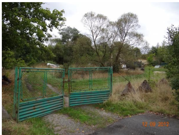
Vjezd k č.p. 11, může být zaplaven.