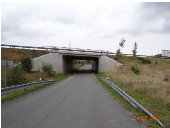
Dálniční most 6072A-1. Dojde k zaplavení podjezdu.