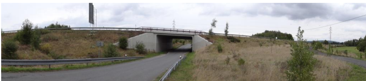
Celkový pohled na lokalitu podjezdu dálnice.