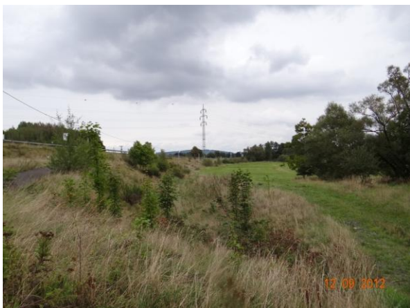
Pohled od dálnice směrem po toku.