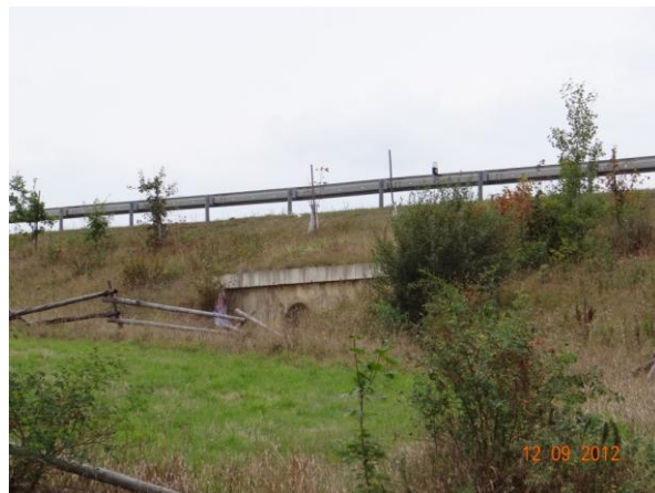
Propust v tělese komunikace I/6.