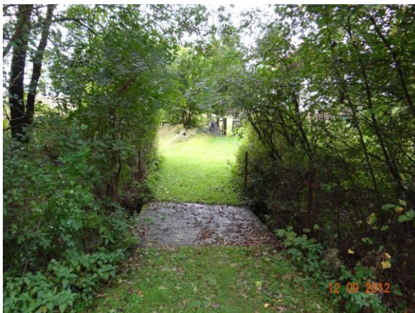
Mostek v místě kritického bodu.