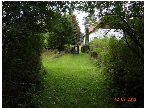
Rekreační objekty jsou položeny výše, mimo potenciální rozliv.