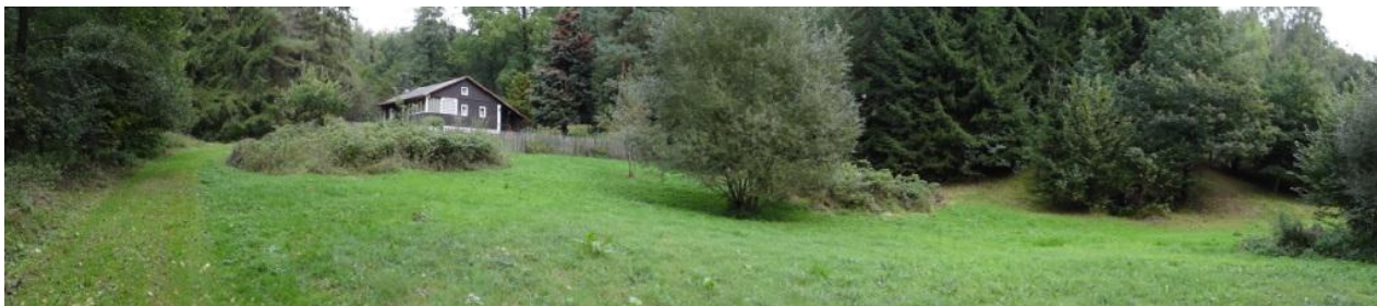
Celkový pohled na umístění rekreačních objektů v místě KB.