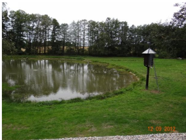
Nově vybudovaný rybník s obtokem.