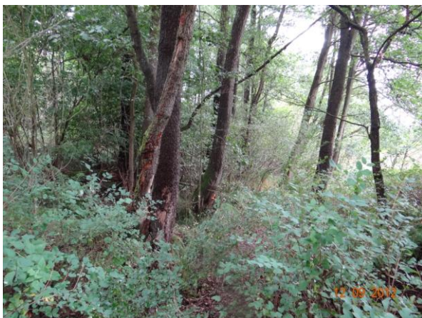
Koryto toku pod kritickým bodem.