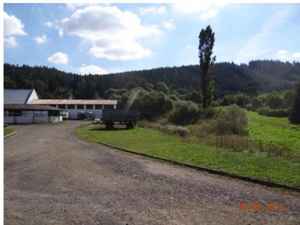
Tok podél statku.