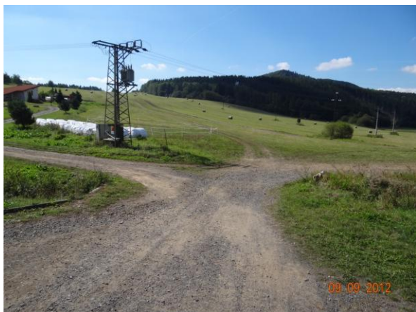
Mostky pro převod koní.