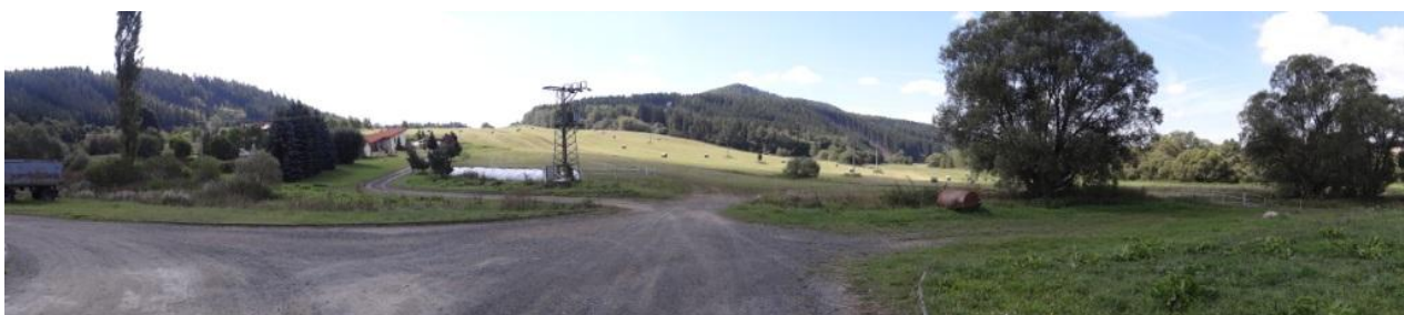
Celkový pohled na areál.