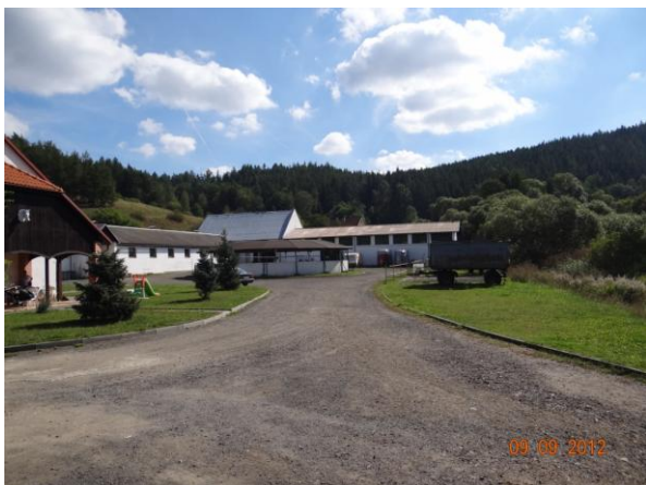
Statek - chov koní.