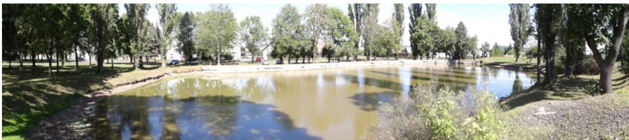
Celkový pohled na návesní rybník.