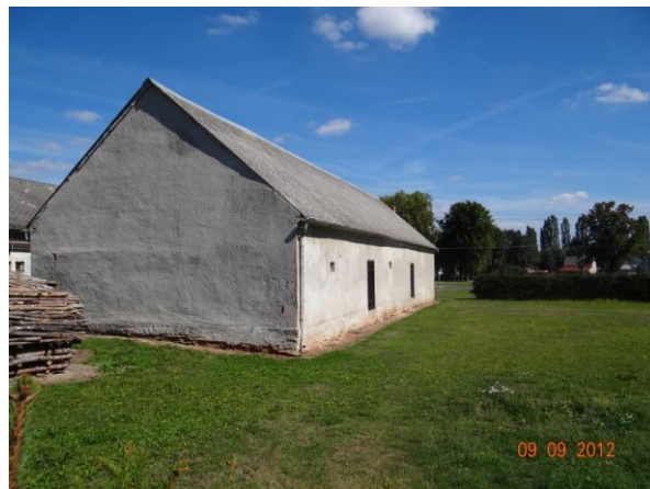
Ohrožené obytné a hospodářské budovy.