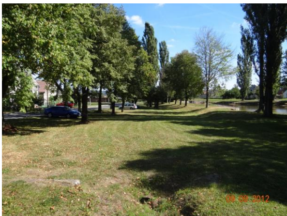
Centrum Novosedel - revizní šachty na rytém profilu.