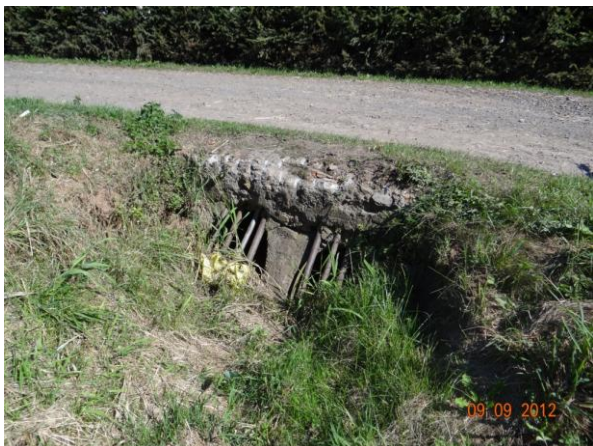
Nátok do krytého profilu - jednoznačně nekapacitní profil.